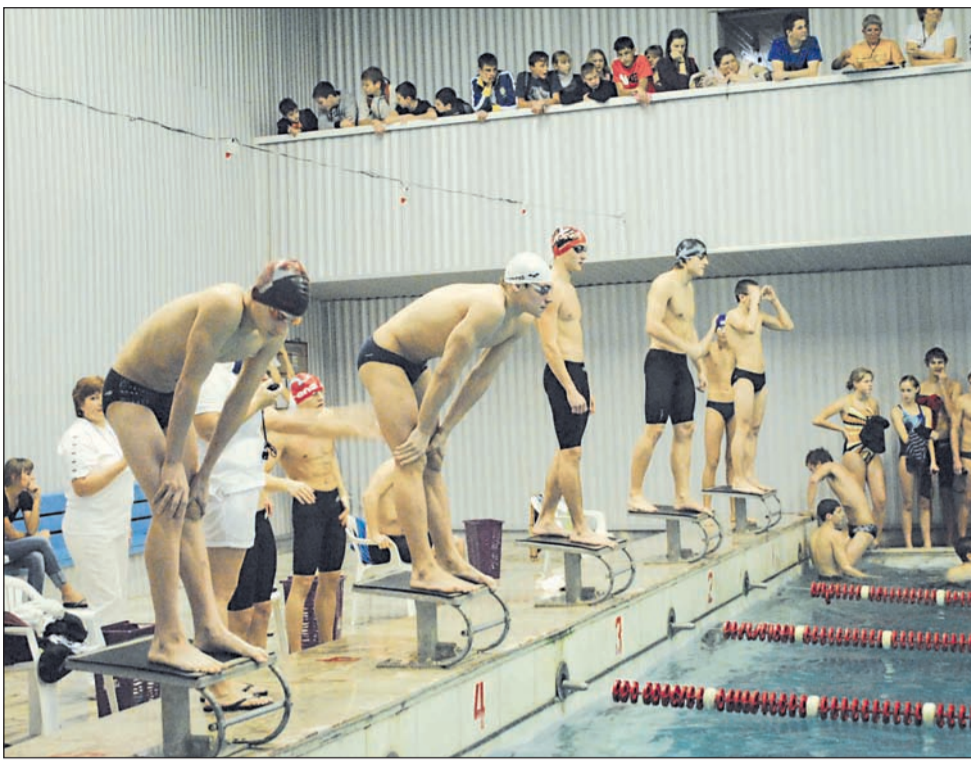
В спорткомплексе «Радуга» завершилось первенство Красноярского края по плаванию среди школьников.

СОРЕВНОВАНИЯ краевого уровня проходят в Железногорске регулярно. В октябре в