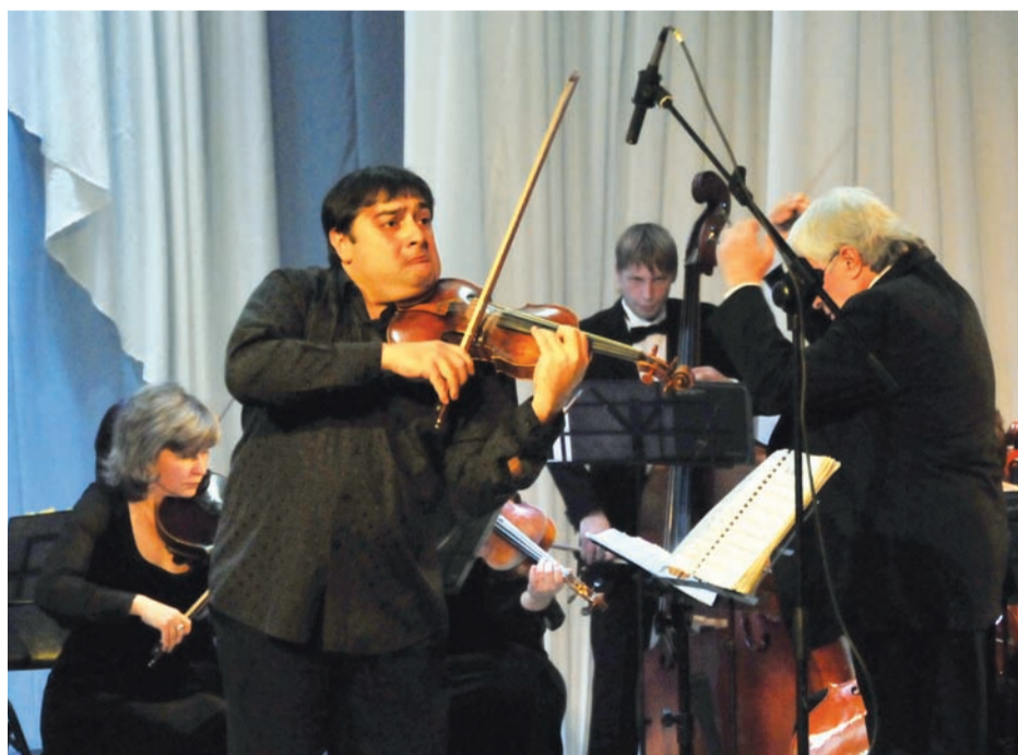
После концерта Граф Муржа дал «ГуГ» небольшое интервью.

Мастерство Графа Муржи ошеломило железногорцев, зрители долго не отпускали маэстро со сцены. На бис виртуоз исполнил известный саргисе ми минор.