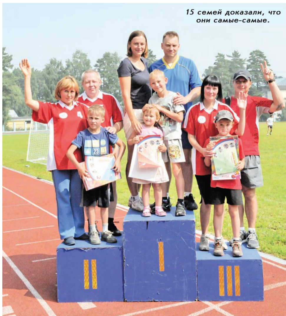
15 семей доказали, что они самые-самые.