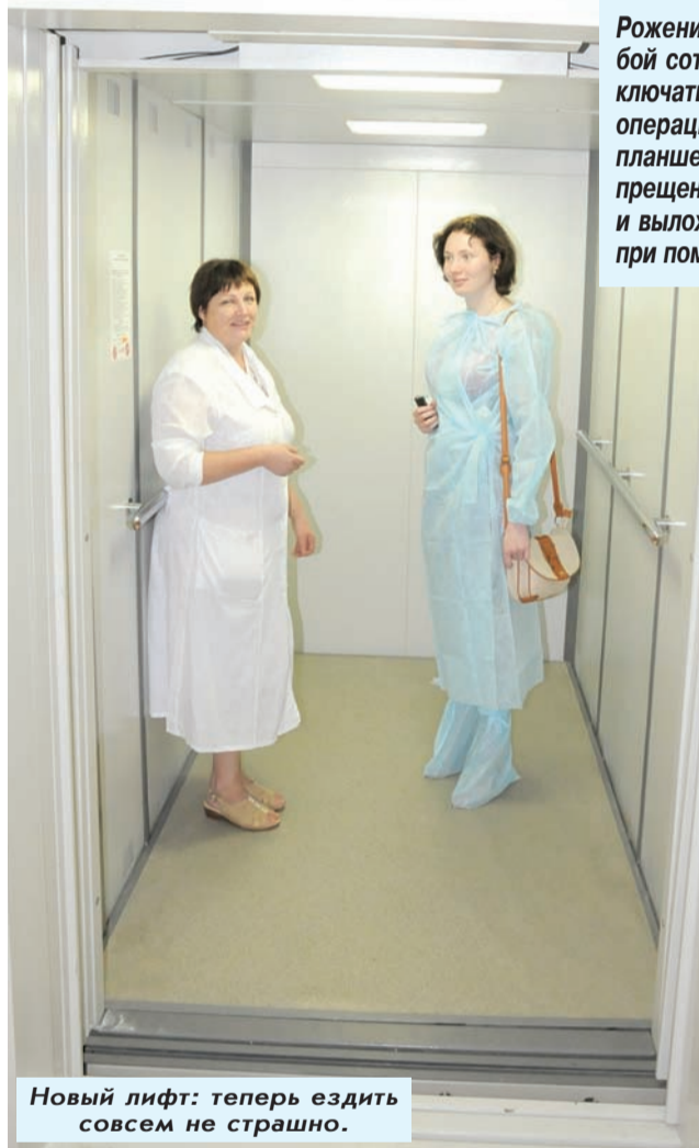
Новый лифт: теперь ездить совсем не страшно.

Но, к сожалению, так думают не все. Точнее, некоторые вообще не думают. Рожают второго, третьего, четвертого ребенка,