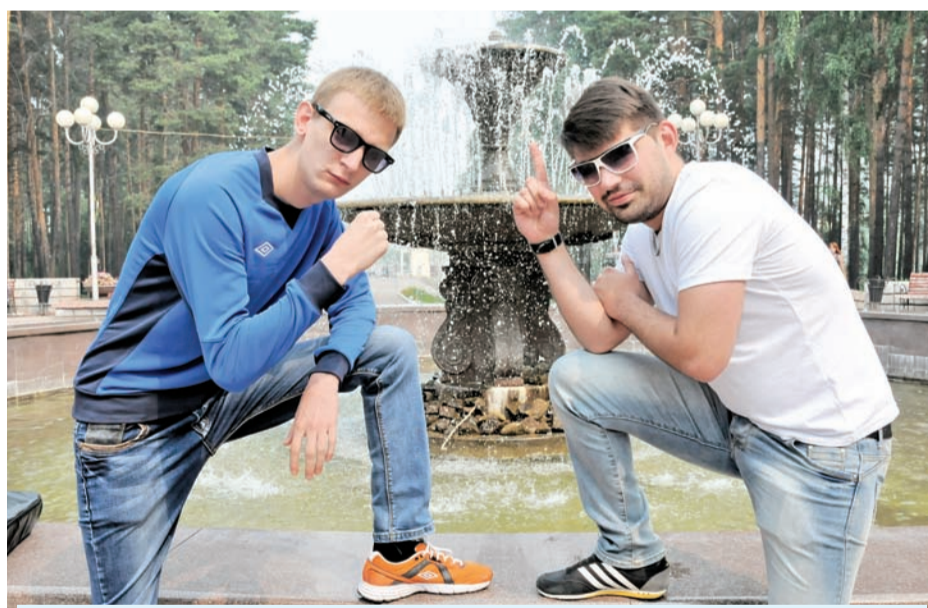
Любимые команды железногорских «плохишей»: «Пирамида» (Владикавказ), «Сборная Камызякского края» (Астраханская область), «Город ПятигорскЪ» (Пятигорск) и «СТЕПиКо» (Новосибирск).