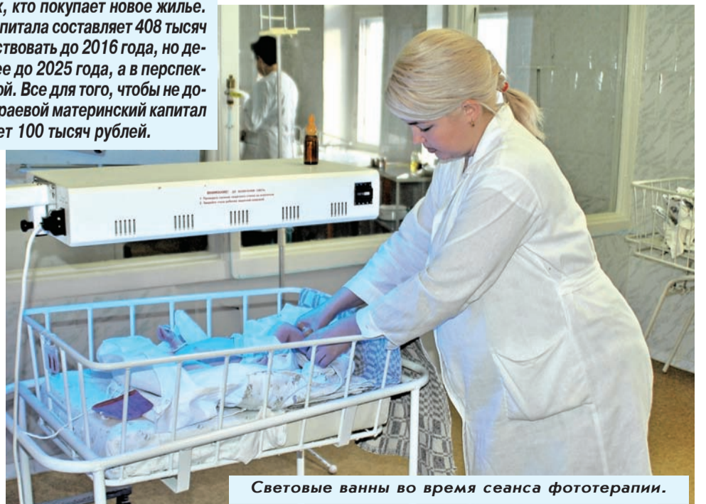
Световые ванны во время сеанса фототерапии.

16-летняя девочка оказывается самой заботливой и внимательной матерью на свете, признаются в роддоме, а бывает 30-летняя женщина, вроде бы взрослая уже, а отказывается нянчить собственного ребенка. Привыкла себя любить, и уже никаких хлопот не хочется. Однако семьи в целом стали ощутимо крепче: отцы малышей ходят на занятия вместе с мамами в женскую консультацию, посещают акушера-гинеколога, беседуют с психологами, даже присутствуют на родах. Начало