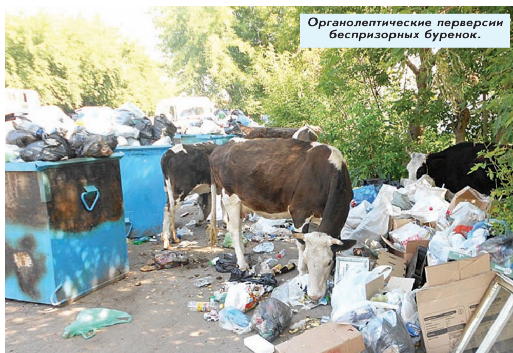
Органолептические перверсии беспризорных буренок.