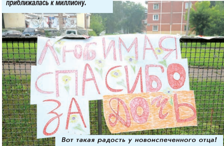
Вот такая радость у новоиспеченного отца!

За 2012 год в стране практически прекратилась естественная убыль населения. Разница между смертностью и рождаемостью снизилась до 2,5 тысяч человек, хотя еще в 2011 году она составляла 130 тысяч, а десятилетием раньше приближалась к миллиону.