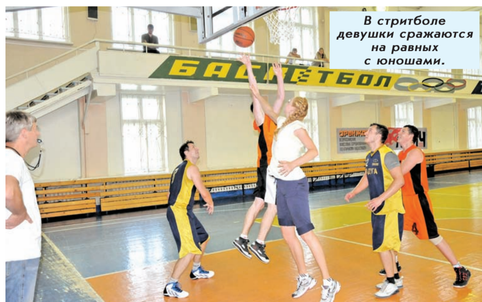
В стритболе девушки сражаются на равных с юношами.