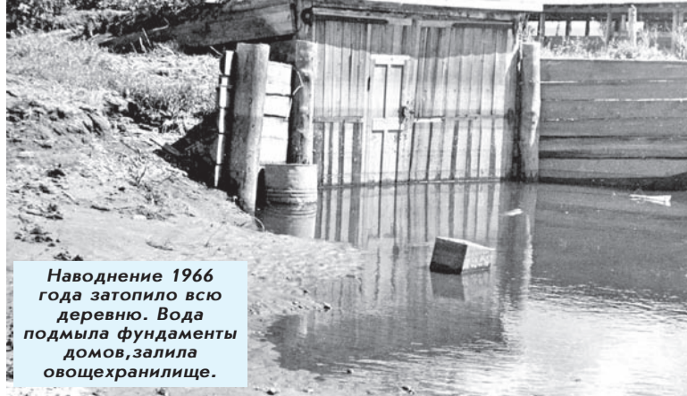
Наводнение 1966 года затопило всю деревню. Вода подмыла фундаменты домов, залила овощехранилище.

Политические события в России не особо касались додоновцев, так как известия до них доходили с опозданием и часто в искаженном виде. Но 1919 год и двигавшаяся на восток армия Колчака не обошли деревню. Подразделения передвигались через Есаулово и Додоново. Отряд дружинников из дезертировавших из армии солдат и мужчин соседних волостей, обосновавшийся в Кантатском логу, дал отпор каппелевцам и даже разогнал в Додоново отряд жандармов в количестве полусотни человек. Но силы были не равны, и деревню все же ограбили: забрали лошадей,