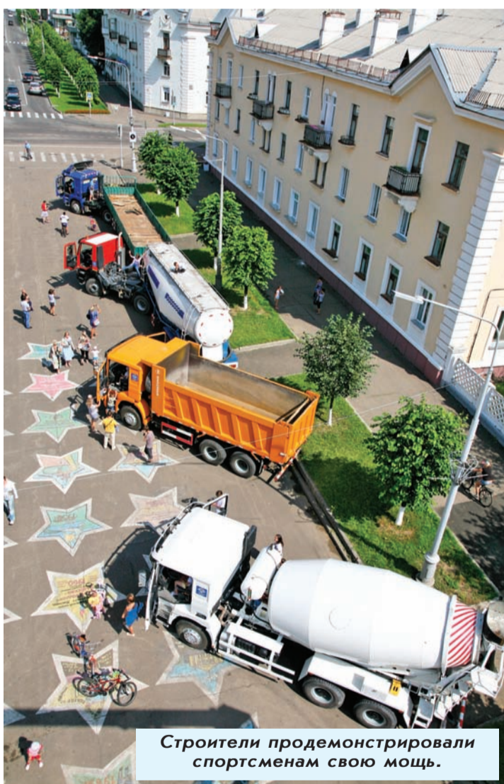
Строители продемонстрировали спортсменам свою мощь.