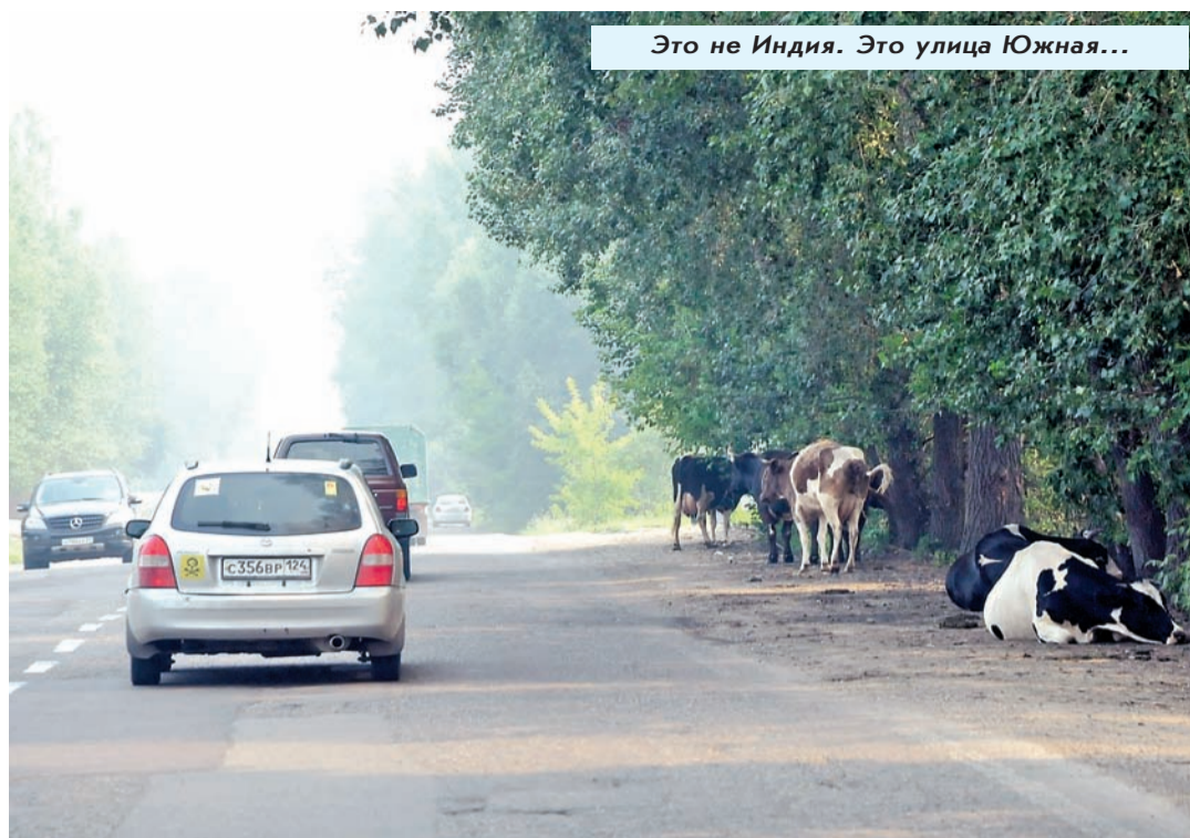
Это не Индия. Это улица Южная...