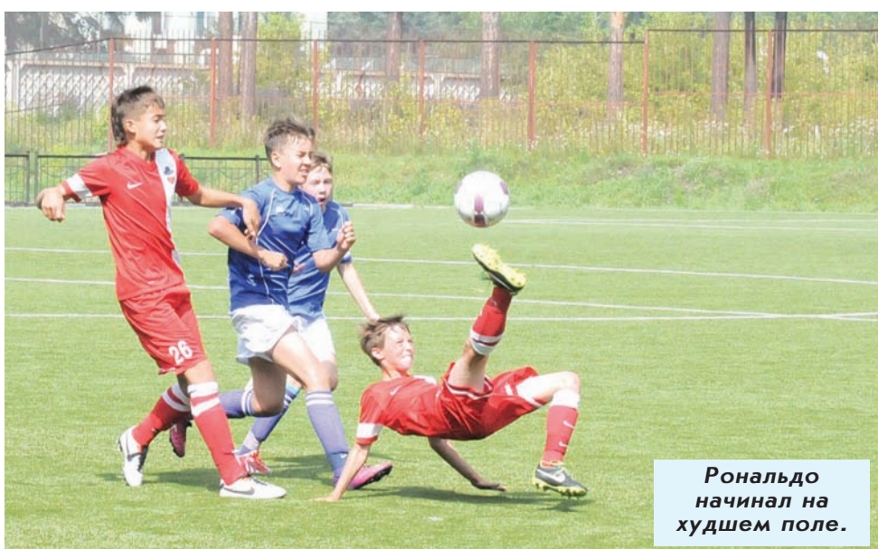
Роналдо начал на худшем поле.