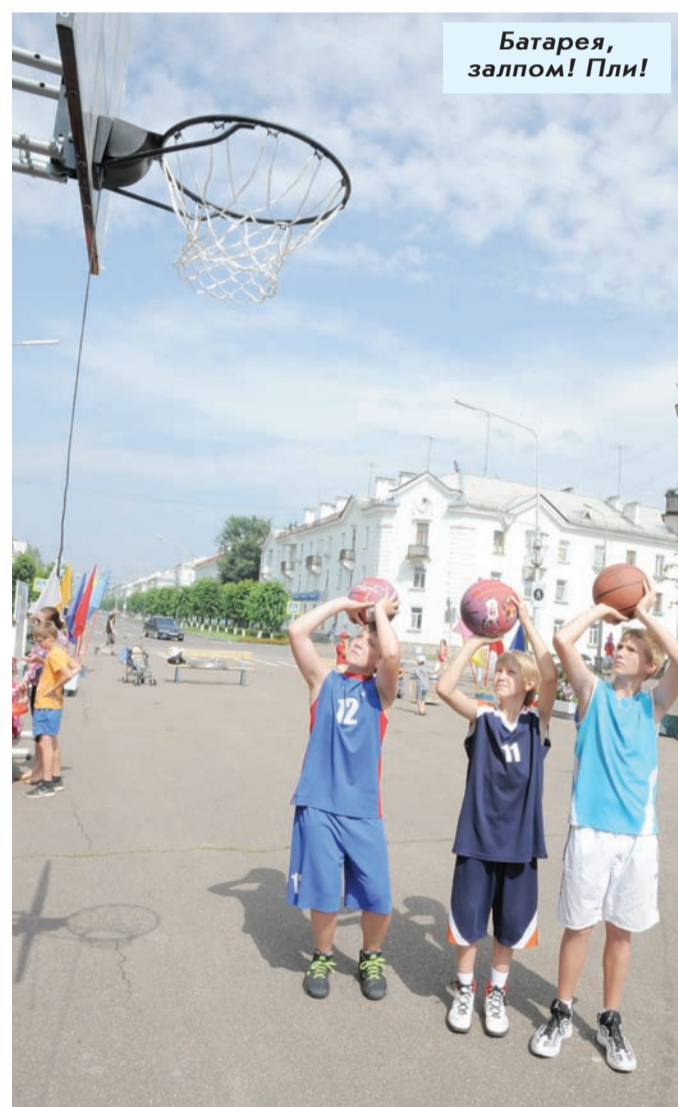
Батарея, залпом! Пли!