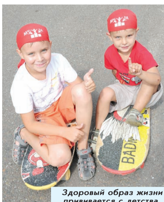
Здоровый образ жизни прививается с детства.