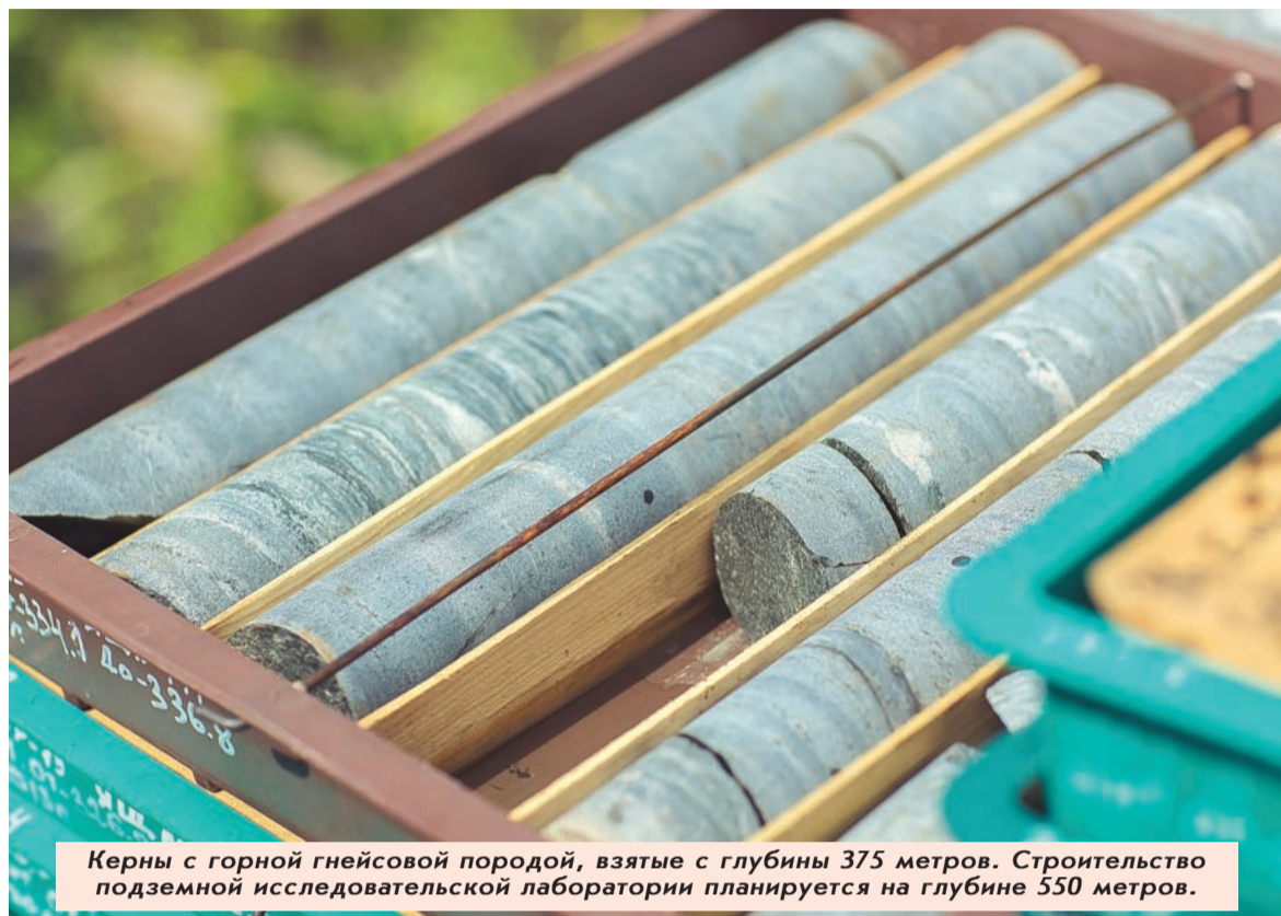
Керны с горной гнейсовой породой, взятые с глубины 375 метров. Строительство подземной исследовательской лаборатории планируется на глубине 550 метров.

Между тем значительное накопление радиоактивных отходов в местах их временного размещения на поверхности, естественно, повышает потенциальную