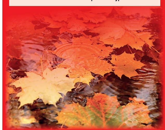
Фото присылать по адресу gig-26@mail.ru с пометкой «На фотоконкурс».

Впереди зимняя, весенняя и летняя фотосессии. Лучшие снимки войдут в глянцевый календарь на 2015 год, к 65-летию Железногорска.