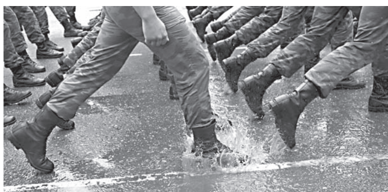
Подготовила Елена НАУМОВА

Осенний призыв осуществляется на основании указа, подписанного