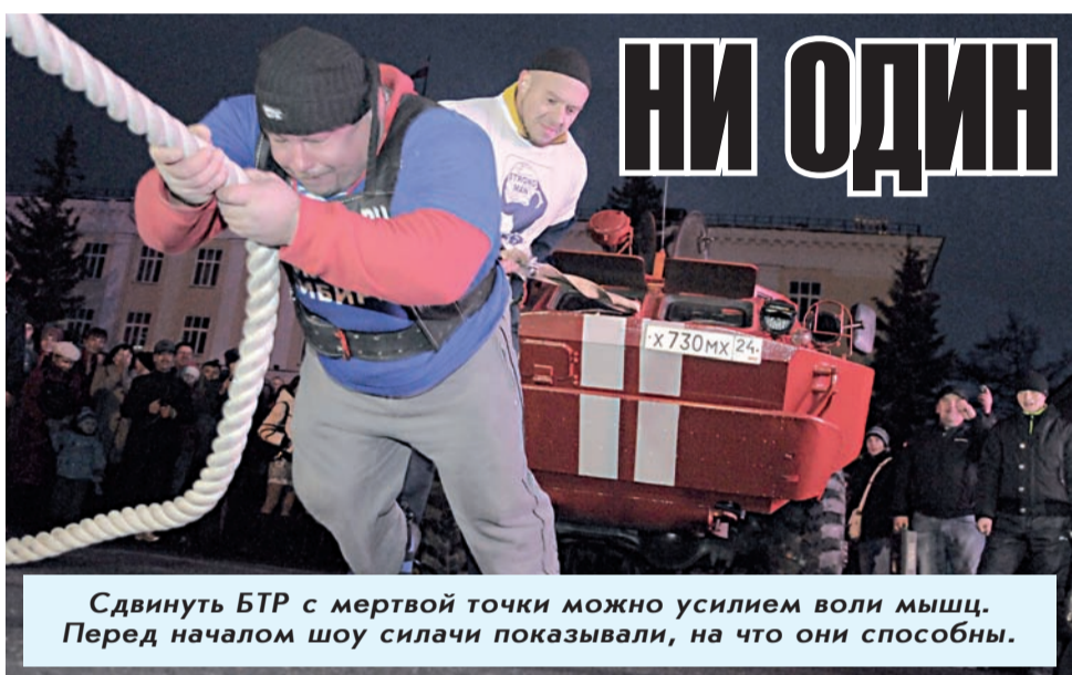
Сдвинуть БТР с мертвой точки можно усилием воли мышц. Перед началом шоу силачи показывали, на что они способны.