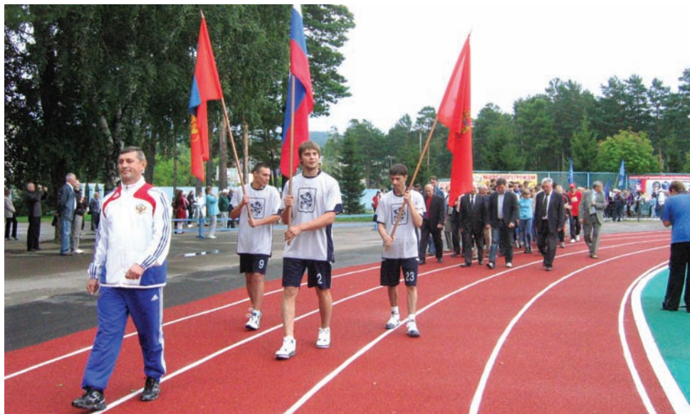
Подготовил Александр ЖЕТМЕКОВ

Заметные успехи сборной города по баскетболу выдвинули ее в число лучших спортивных команд в 2013 году. Также высоко была оценена работа Красноярской региональной молодежной организации «Федерация здорового образа жизни».