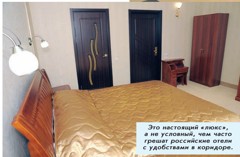
Это настоящий «люкс», а не условный, чем часто грешат российские отели с удобствами в коридоре.

Гостиница стала второй очередью комплекса зданий, построенных на Северной, 1г. Год назад там открылся фитнес-центр «Олимп», спустя еще 12 месяцев специальный переход присоединил к спортивному клубу отель с одноименным названием. Возможно, кому-то место для отдыха и проживания покажется сегодня не самым выгодным – Северную принято считать окраиной. Но, учитывая перспективную застройку именно этой части города, в ближайшее время здесь появится молодежный микрорайон для сотрудников ИСС, решается вопрос с транспортной доступностью (речь идет о создании новых остановок для автобусов) – через год-два здесь обретет прописку довольно бойкое место, в том числе и с точки зрения деловой инфраструктуры. Плюс близость головных офисов градообразующих предприятий, контрагенты которых