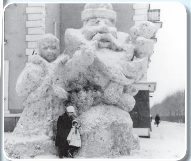
В ногах у Деда Мороза. 1977 год.