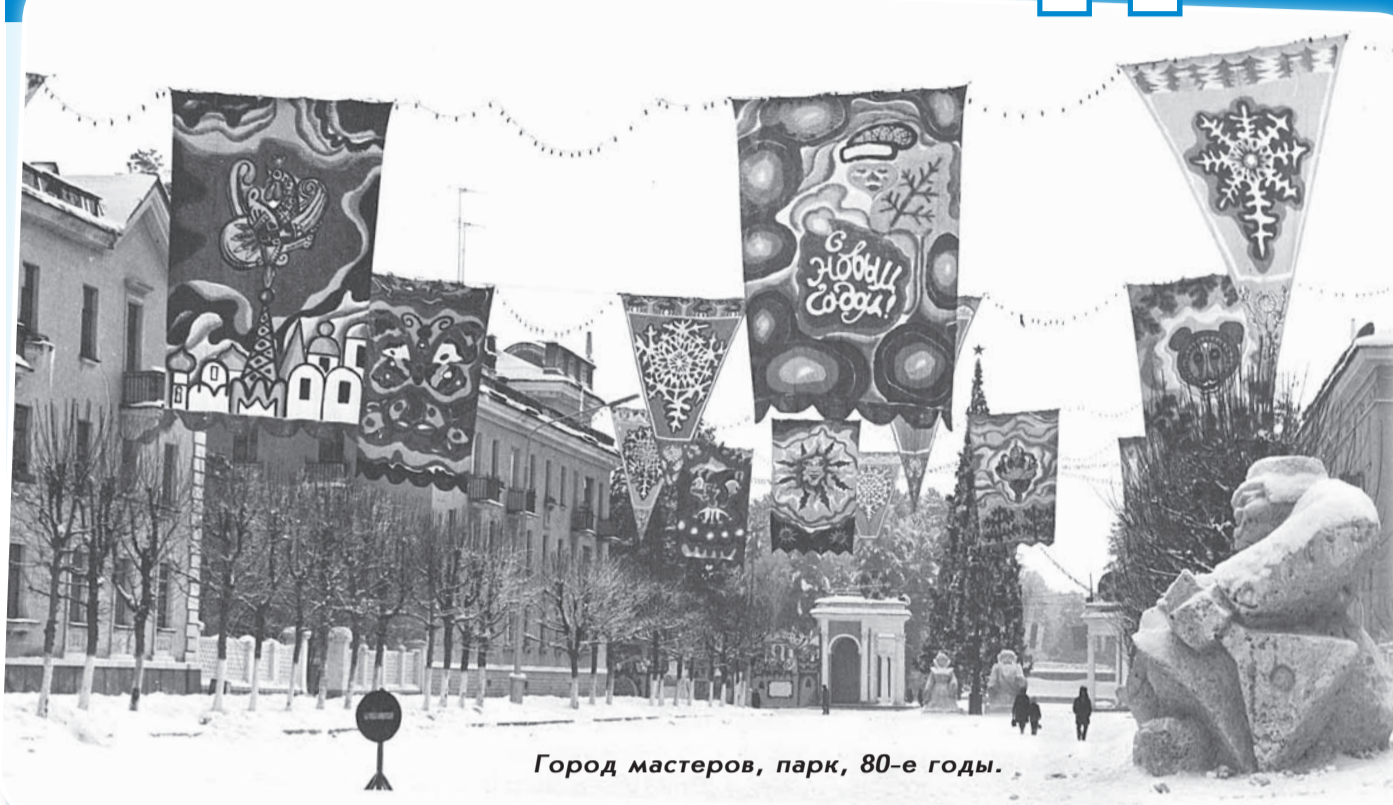
Город мастеров, парк, 80-е годы.