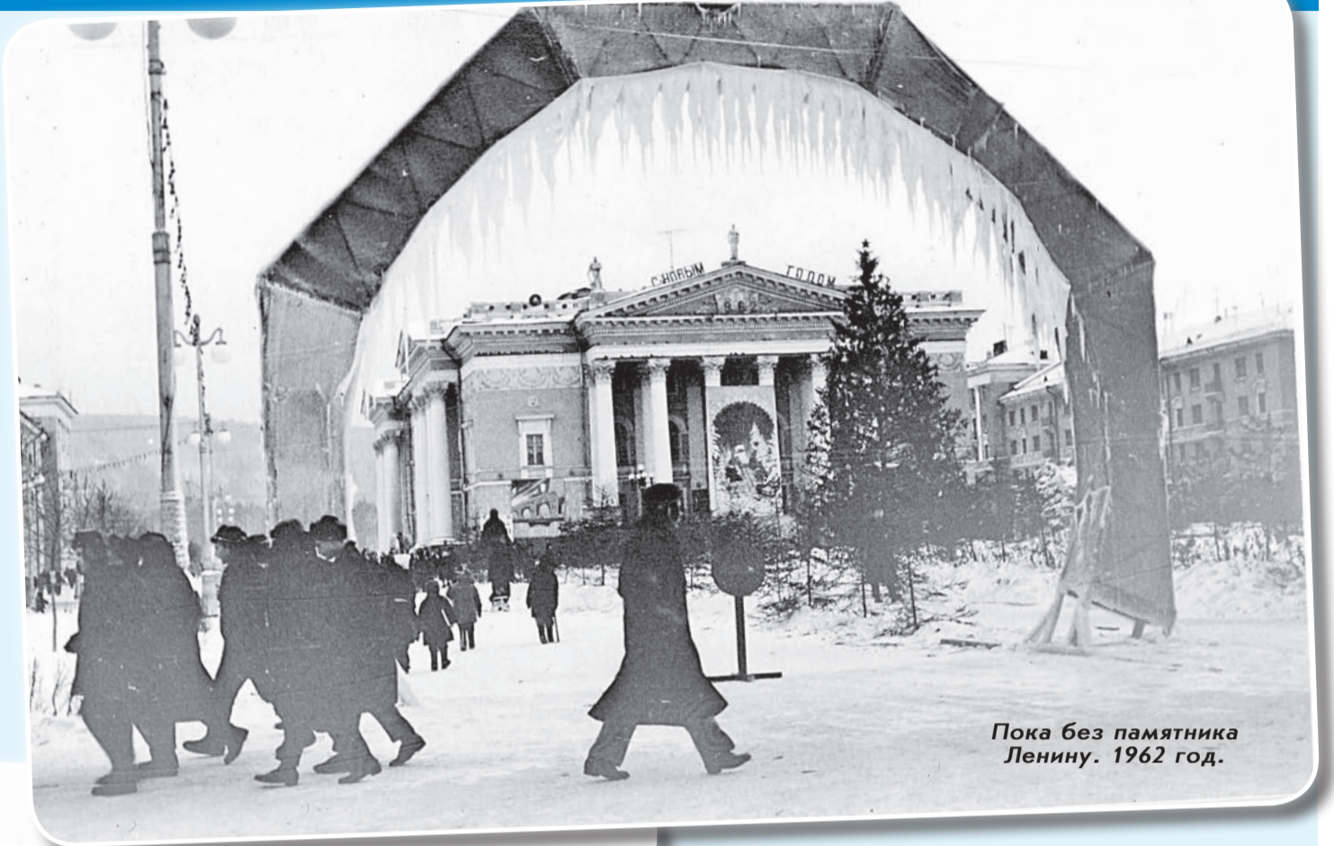
Пока без памятника Ленину. 1962 год.

Эти воспоминания о главной елке в центре города — сначала на площади, а потом у парка, о примерке костюма из марли, о катании на деревянной горке до умопомрачения и дыр на коленках на штанах с начесом знакомы каждому, кто родился в той самой стране. Очень многого не хватает из той жизни, даже если фигуры из снега у парка или «Теля» через несколько дней упрямо темнели, Дед Мороз отчего-то задерживался, а ты все никак не мог отыскать нарисованную тобой в школе игрушку на городской елке. Все это было-было-было... Каждый из редакции «ГиГ» принес фотографии из праздничного прошлого, также подключился железногорский музей со своими уникальными архивами. Посмотрите, может, и вы припомните те счастливые времена - когда новогодние деревья были большими.