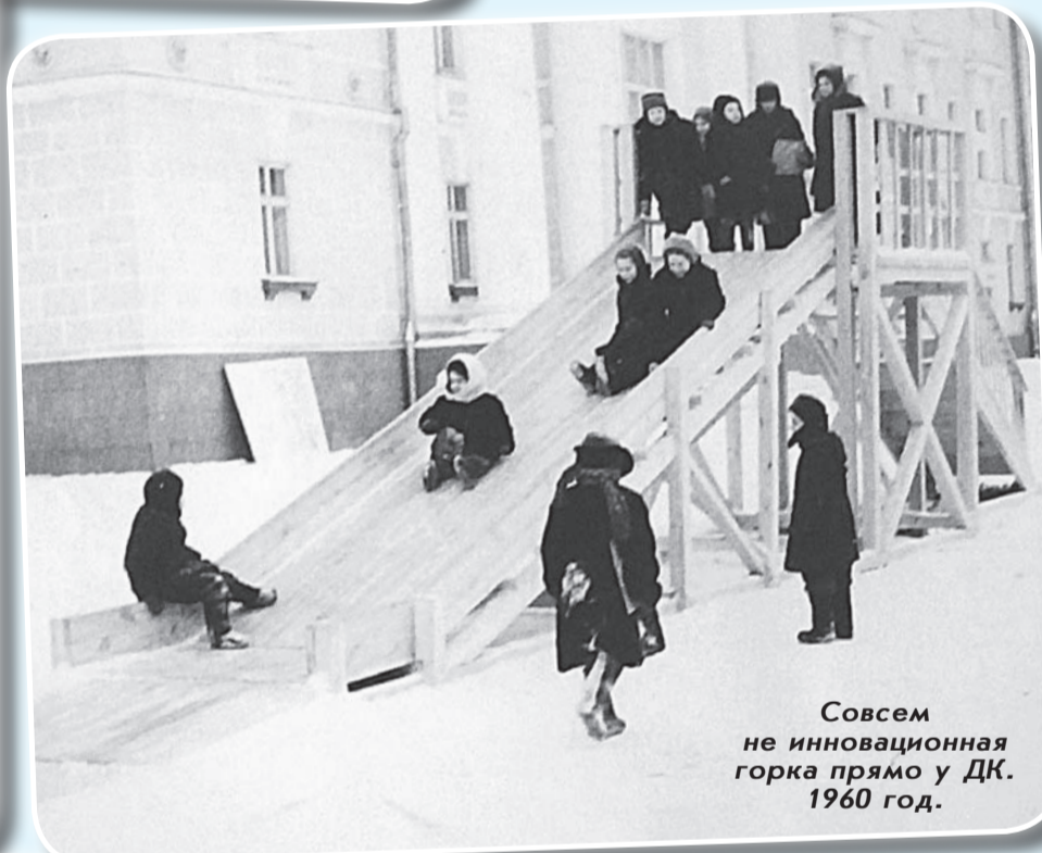
Совершенно не инновационная горка прямо у ДК. 1960 год.