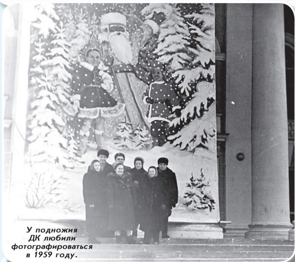
У подножия ДК любили фотографироваться в 1959 году.