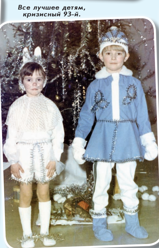
Все лучшее детям, кризисный 93-й.