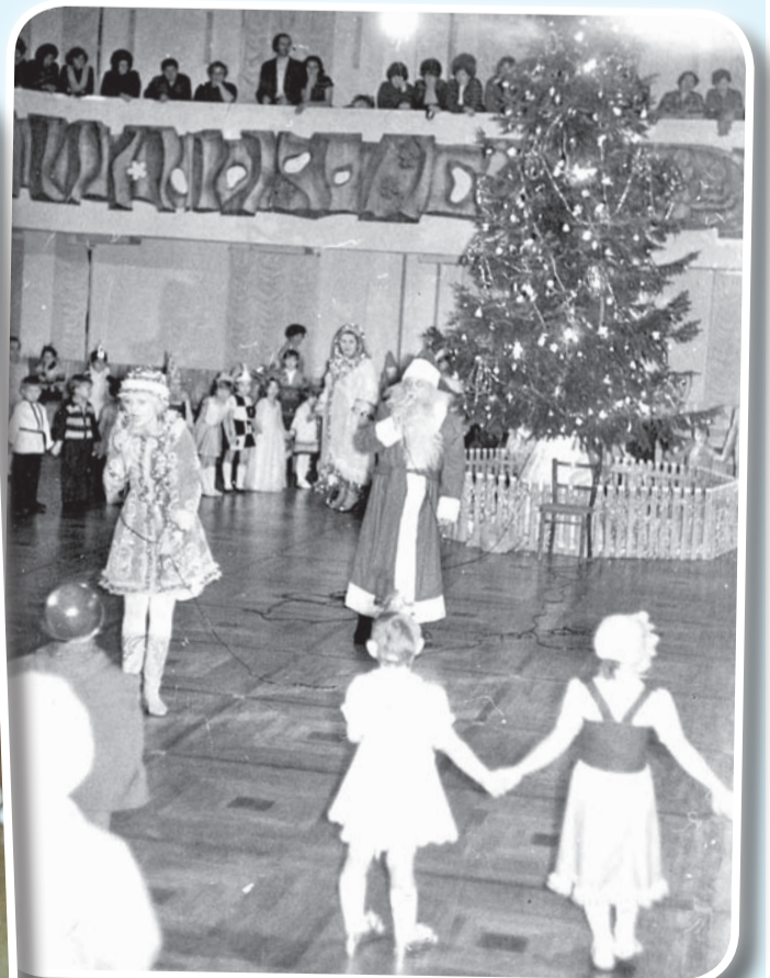
Первый утренник в ТКЗ. 1981 год.