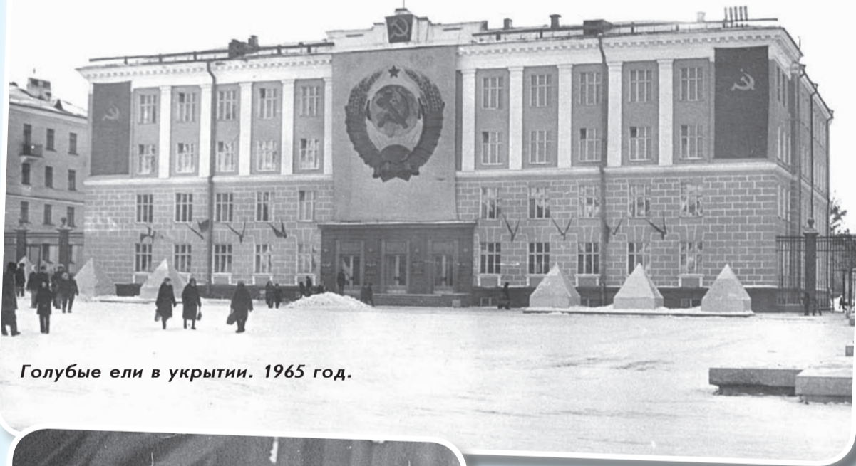
Голубые ели в укрытии. 1965 год.