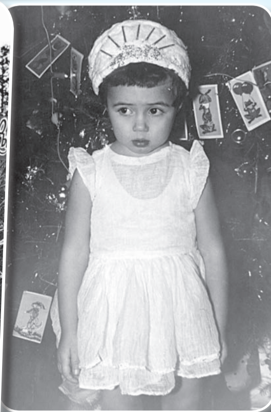
Снежинка в костюме из марли – тренд всех времен. 1967 год.