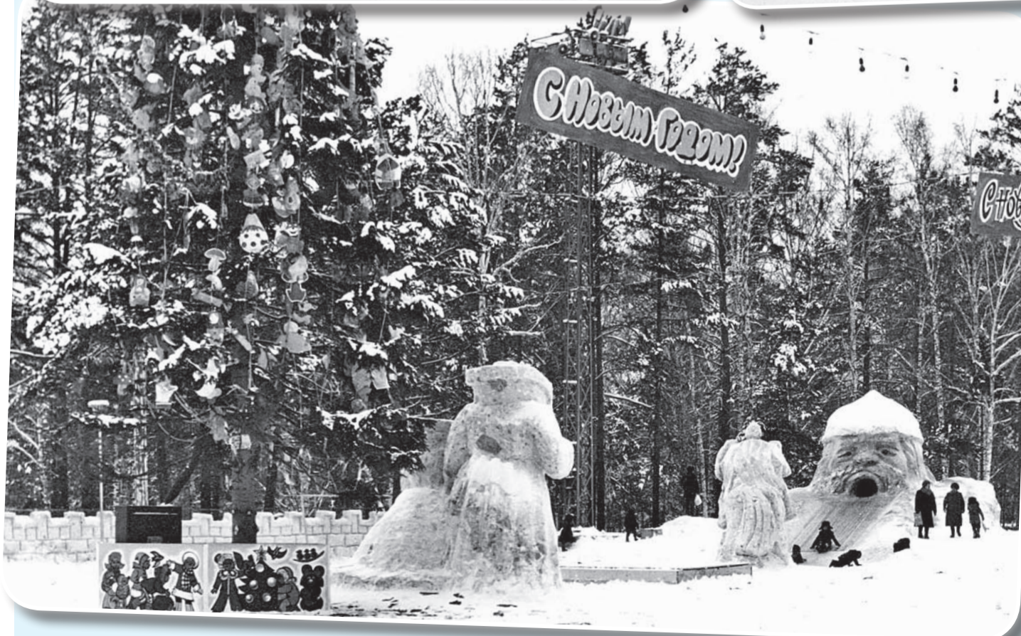
В ухо влезает, из рта выезжает. Знаменитая горка «Руслан» у «Теля». Середина 80-х.