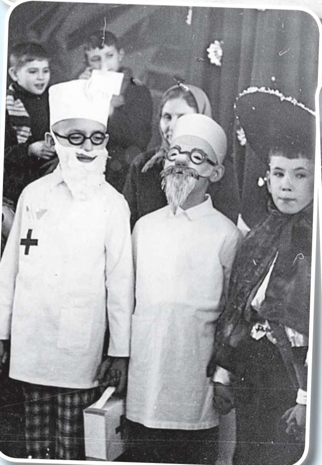
Эх, какие врачи были в советское время! 1969 год.