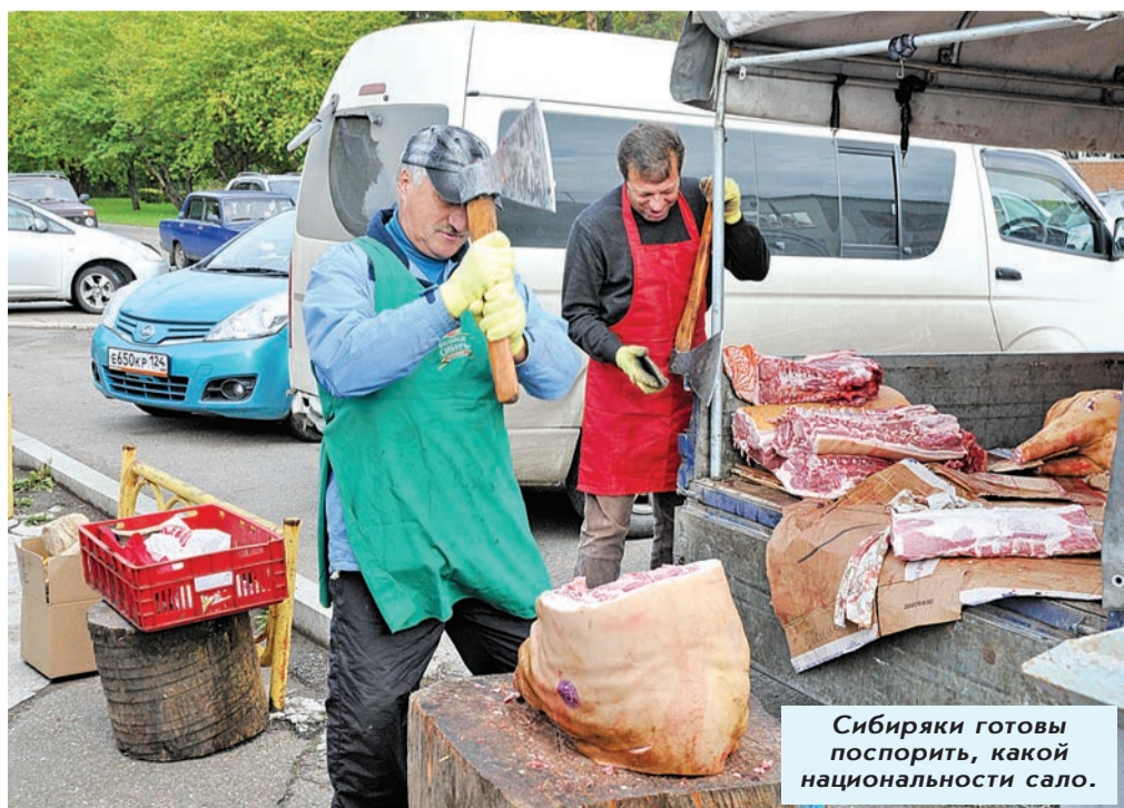
Сибиряки готовы поспорить, какой национальности сало.

В свое время зеленое хозяйство (МП «АГРО») в качестве умирающего муниципального собрата буквально спасли от