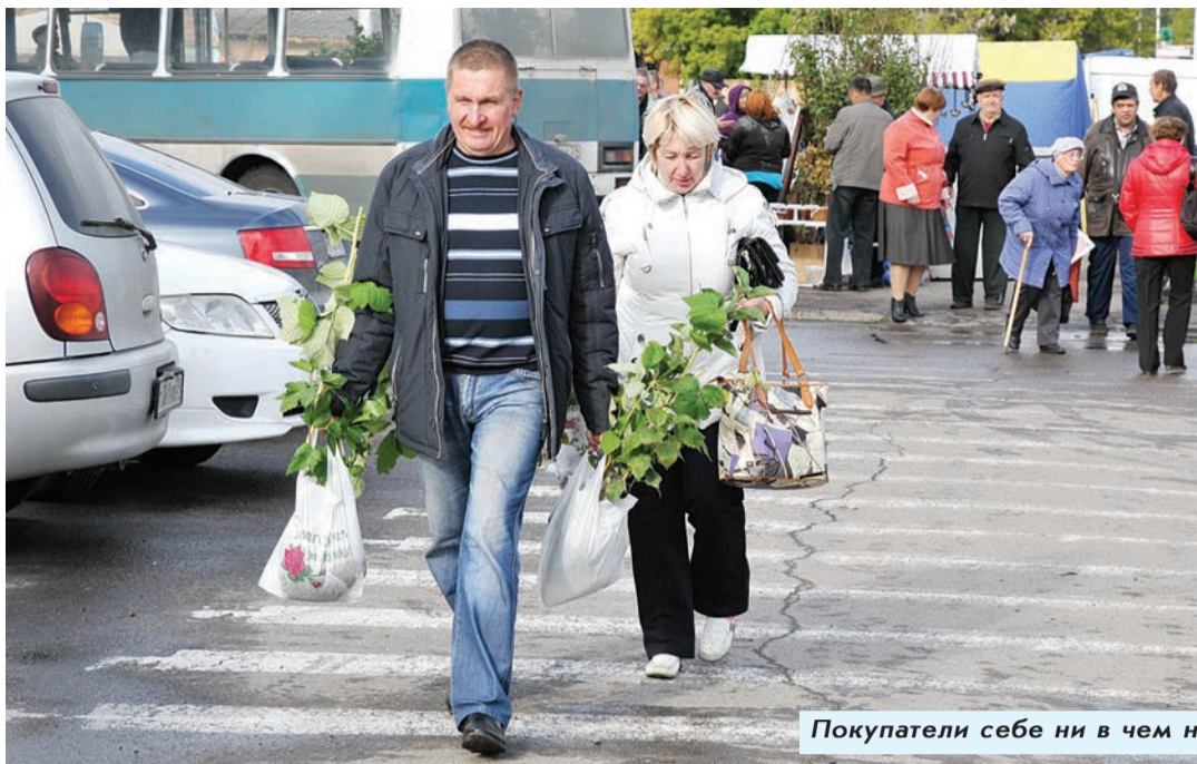
Покупатели себе ни в чем не отказывали.