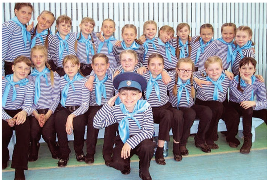
«Мы в тельняшках!»