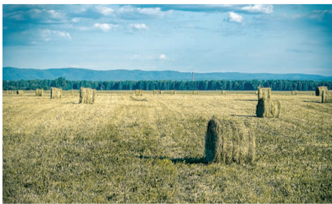
Роман ЛИХОЛАТ «Поле. Русское поле»