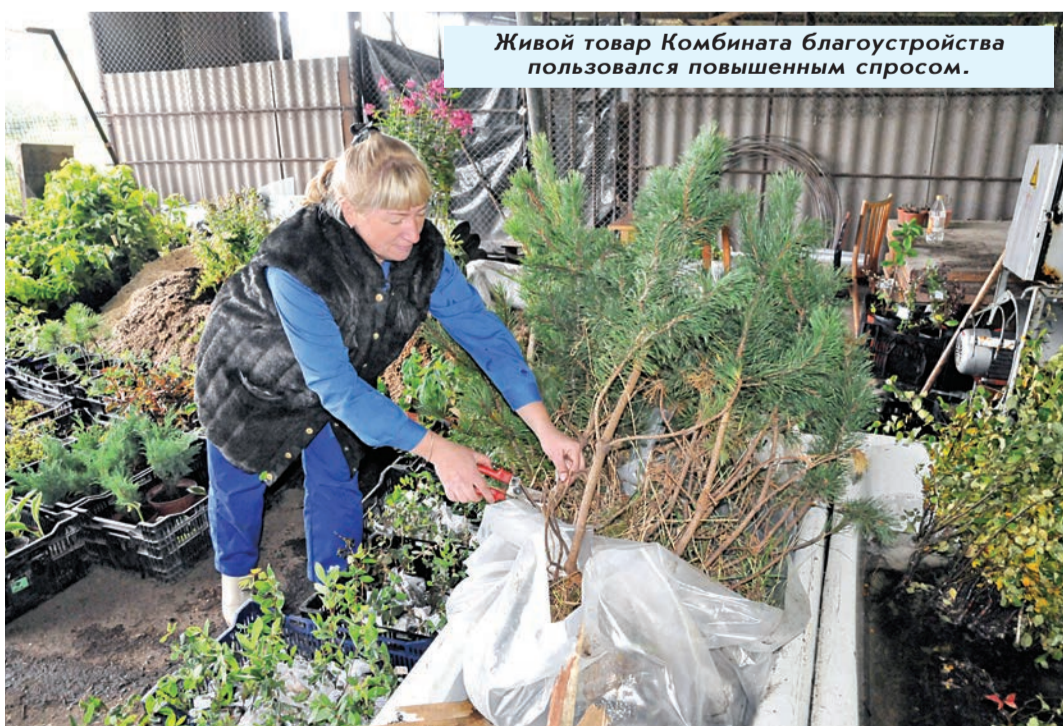
Живой товар Комбината благоустройства пользовался повышенным спросом.