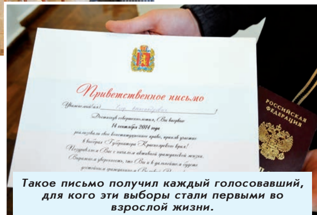
Такое письмо получил каждый голосовавший, для кого эти выборы стали первыми во взрослой жизни.

- Считаю, что эпоха волеизъявления и демократии в России кончилась, так толком и не начавшись. Позывы были в 90-е