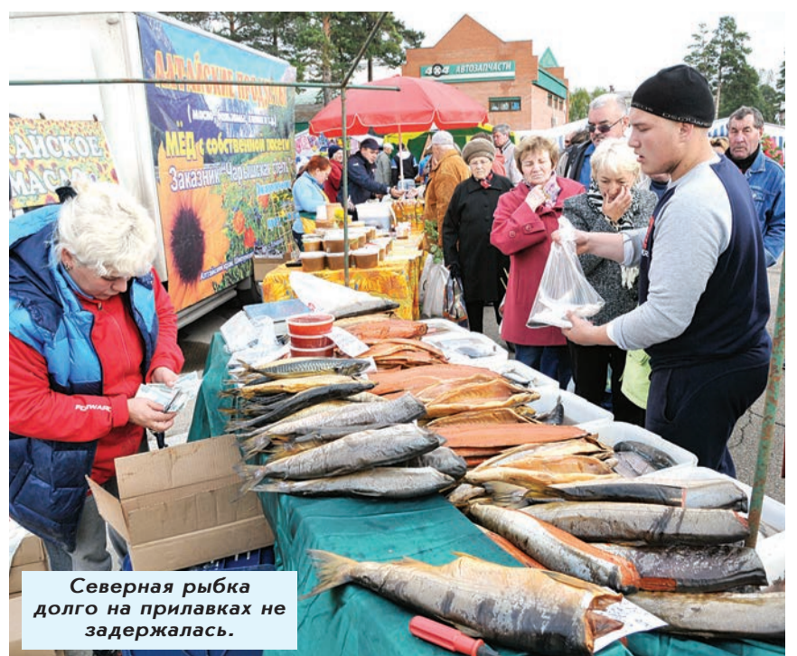
Северная рыбка долго на прилавках не задержалась.