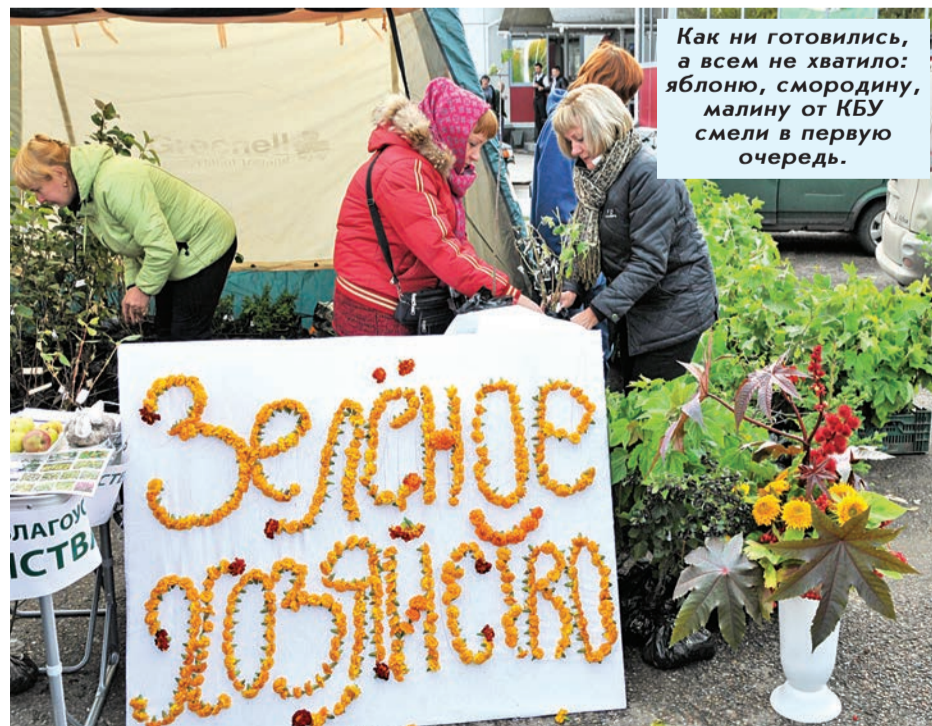
Как ни готовились, а всем не хватило: яблоню, смородину, малину от КБУ смели в первую очередь.