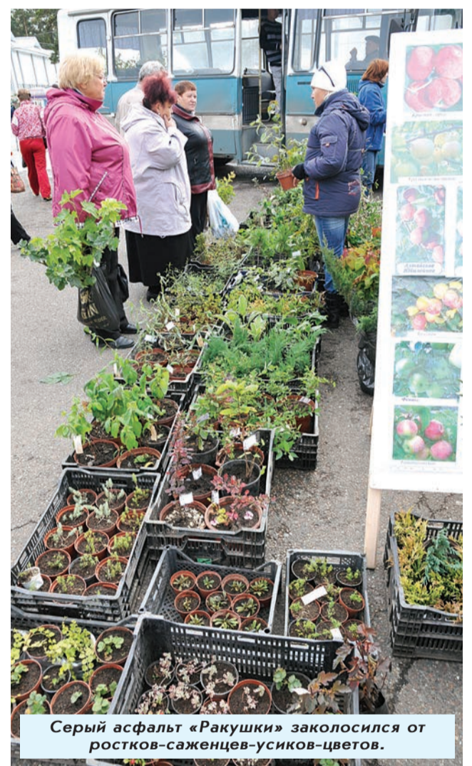
Серый асфальт «Ракушки» заколосился от ростков-саженцев-усиков-цветов.