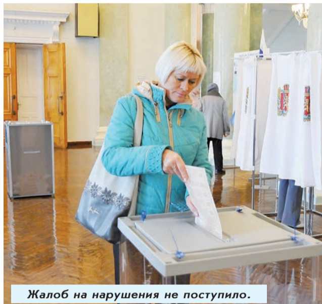
Жалоб на нарушения не поступило.