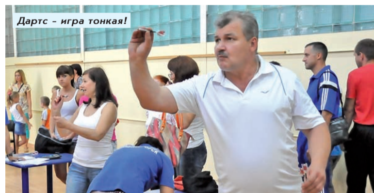
Дартс – игра тонкая!