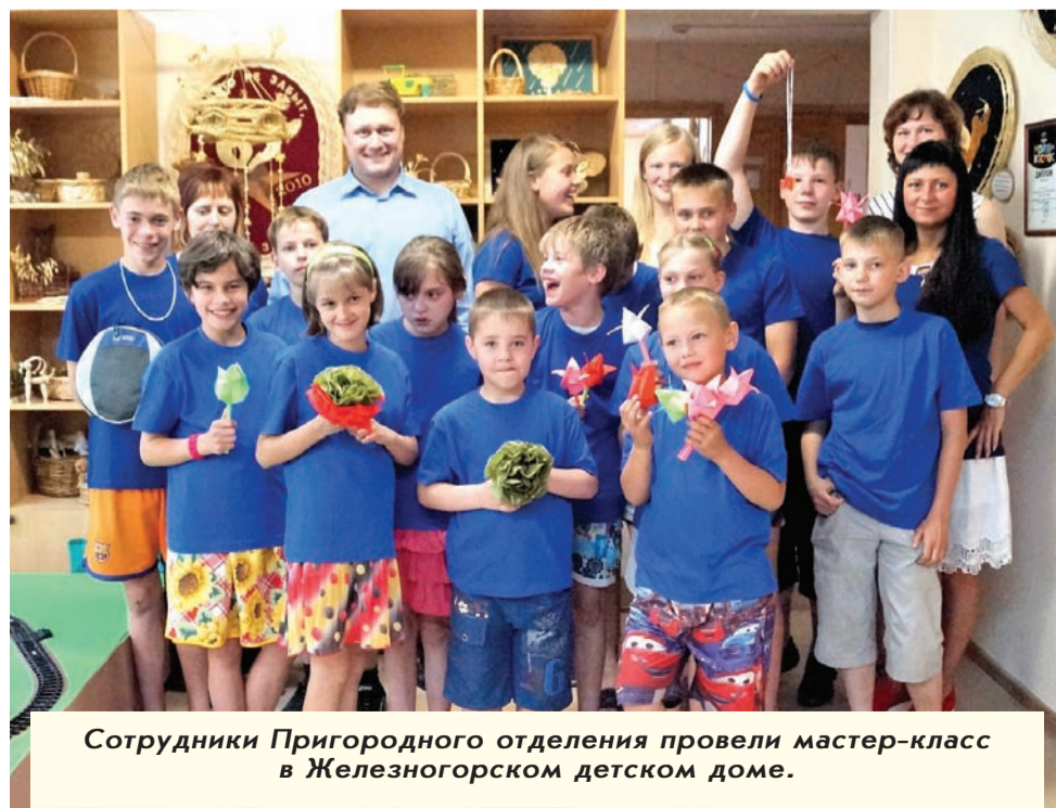
Сотрудники Пригородного отделения провели мастер-класс в Железнодорожном детском доме.