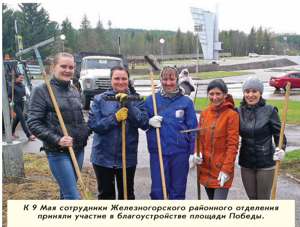
К 9 Мая сотрудники Железнодорожного районного отделения приняли участие в благоустройстве площади Победы.