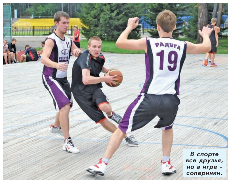
В спорте все друзья, но в игре – соперники.