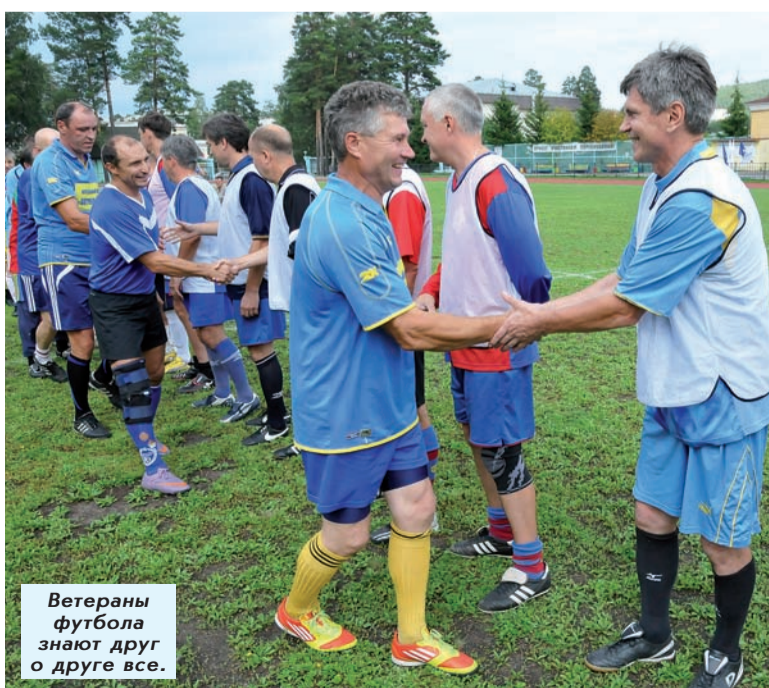
Ветераны футбола знают друг о друге все.