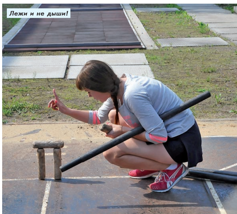
Лежи и не дыши!