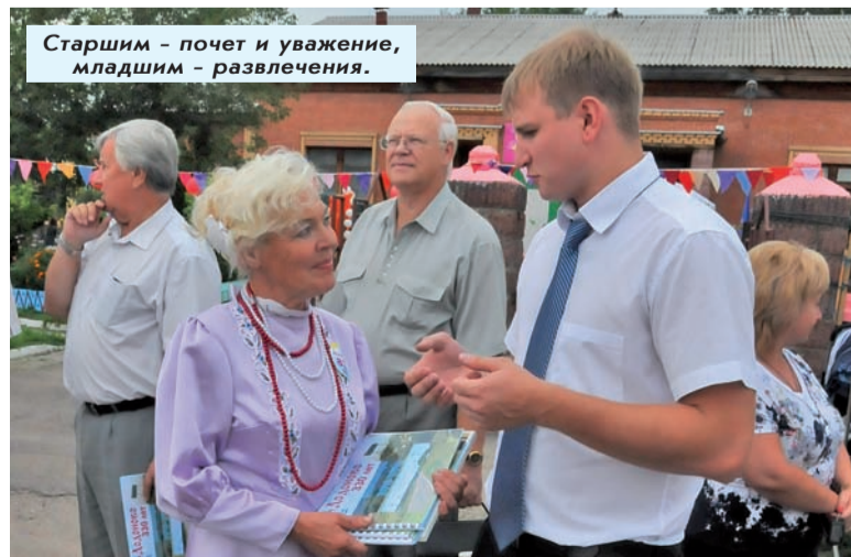
Старшим - почет и уважение, младшим - развлечения.