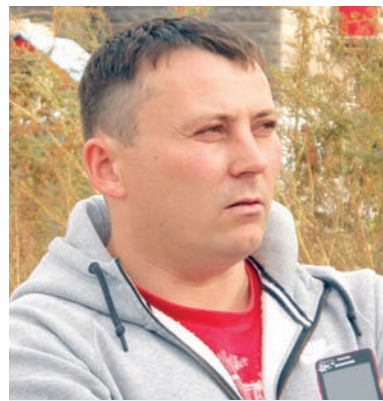
Сергей Сергеевич: «Когда мы заключали договоры в 2013-м, никакие разговоры о сдвиге сроков не было. Нас заведомо обманули!»