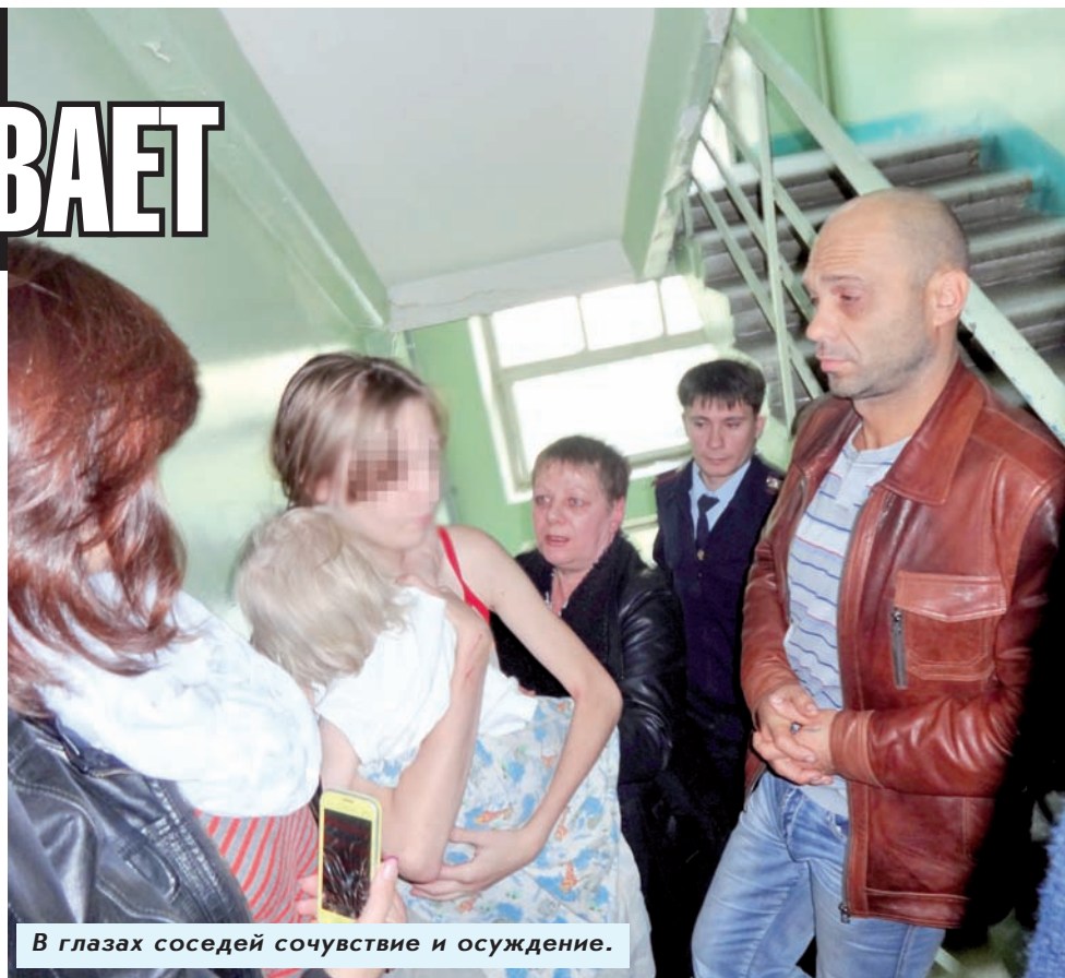
В глазах соседней сочувствие и осуждение.

В этот раз на мать составили административный протокол, а информацию передали всем