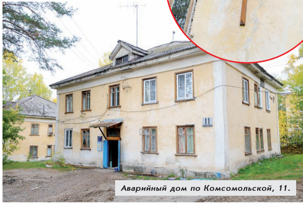
Аварийный дом по Комсомольской, 11.