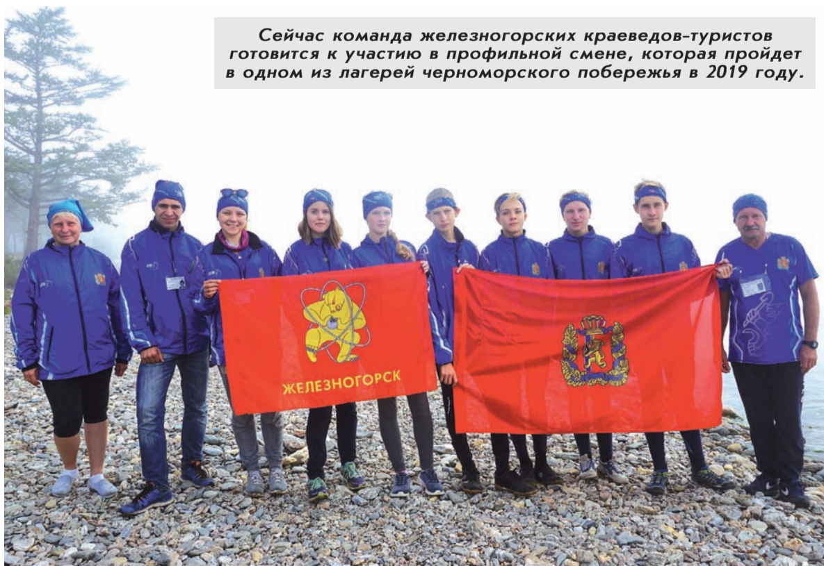
Сейчас команда железногорских краеведов-туристов готовится к участию в профильной смене, которая пройдет в одном из лагерей черноморского побережья в 2019 году.