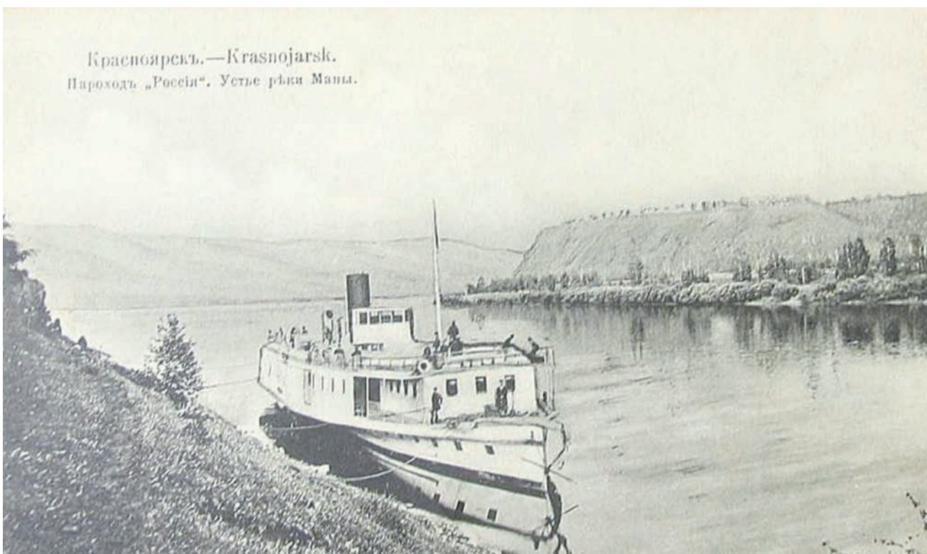
Пароход «Россия» («Модест»). С 1923 по 1930 год он назывался «Владимир Ленин», с 1930-го - «Владимир Маяковский», списан в 1962 году.

Пароход «Модест» сделал несколько рейсов до Енисейска, а в сентябре 1898 года на Казачинских порогах произошла катастрофа. Судно потеряло управление, его понесло на подводную скалу. Хорошо, что штурман все же сумел развернуть судно поперек