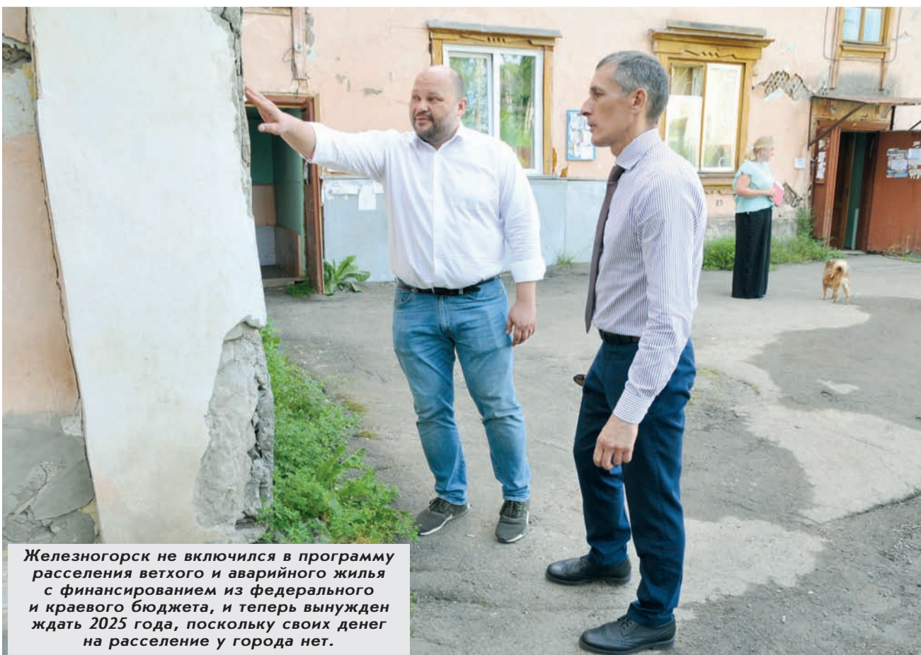
Железногорск не вошел в программу расселения ветхого и аварийного жилья с финансированием из федерального и краевого бюджета, и теперь вынужден ждать 2025 года, поскольку своих денег на расселение у города нет.