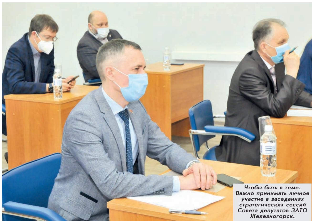
Чтобы быть в теме. Важно принимать личное участие в заседаниях стратегических сессий Совета депутатов ЗАТО Железногорск.

Мы также видим динамику доходов и расходов муниципального бюджета за несколько лет. Доходы бюджета за период с 2009