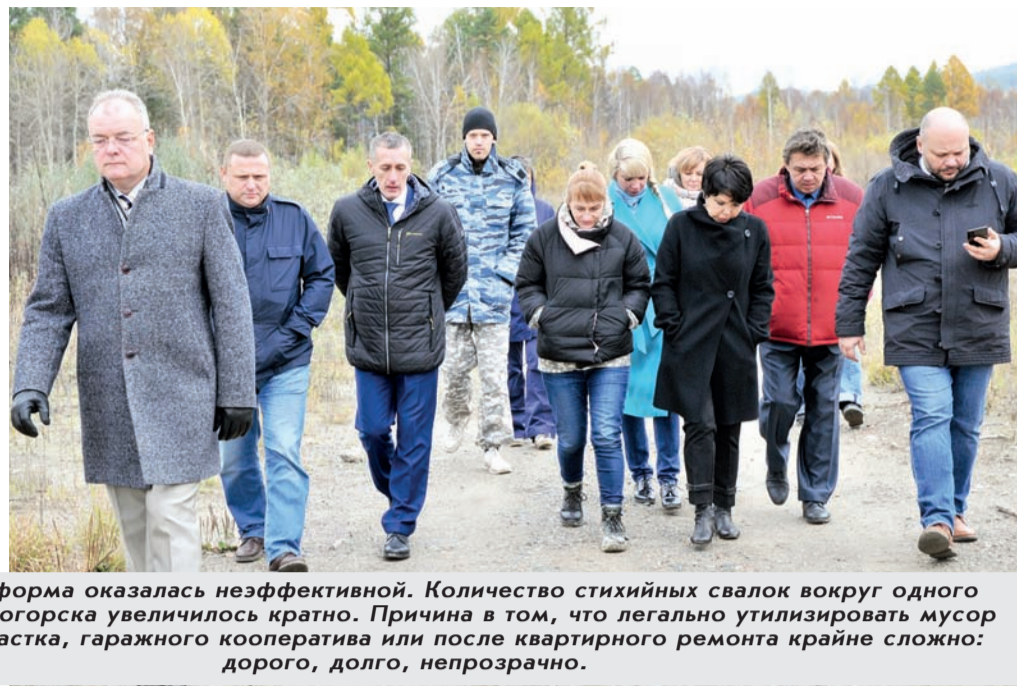
Мусорная реформа оказалась неэффективной. Количество стихийных свалок вокруг одного только Железногорска увеличилось кратно. Причина в том, что легально утилизировать мусор с садового участка, гаражного кооператива или после квартирного ремонта крайне сложно: дорого, долго, непрозрачно.

по 2019 год увеличились на 12%, расходы за тот же период - на 17%. При этом только официальная статистика говорит, что инфляция за этот же период составила 76,3%. Недофинансирование, а фактически снижение объема, вызвано, в частности, уменьшением размера дотации на развитие инфраструктуры с 2010 года. Если оценить расходы по крупнейшим статьям бюджета (образование, культура, спорт), то ситуация выглядит не столь мрачной, рост за период составляет 69, 107 и 62 процента соответственно. Но совершенно определенно, этот рост недостаточен для сохранения отрасли, тем более для ее какого-либо развития. Практически весь рост уходит в повышение заработной платы, безусловно, необходимую меру - мы поддерживаем конкурентную заработную плату специалистов в отрасли. Но удельный вес расходов на ремонт, реконструкцию, оборудование уменьшается год от года. И это неминуемо приведет к распаду этих отраслей.