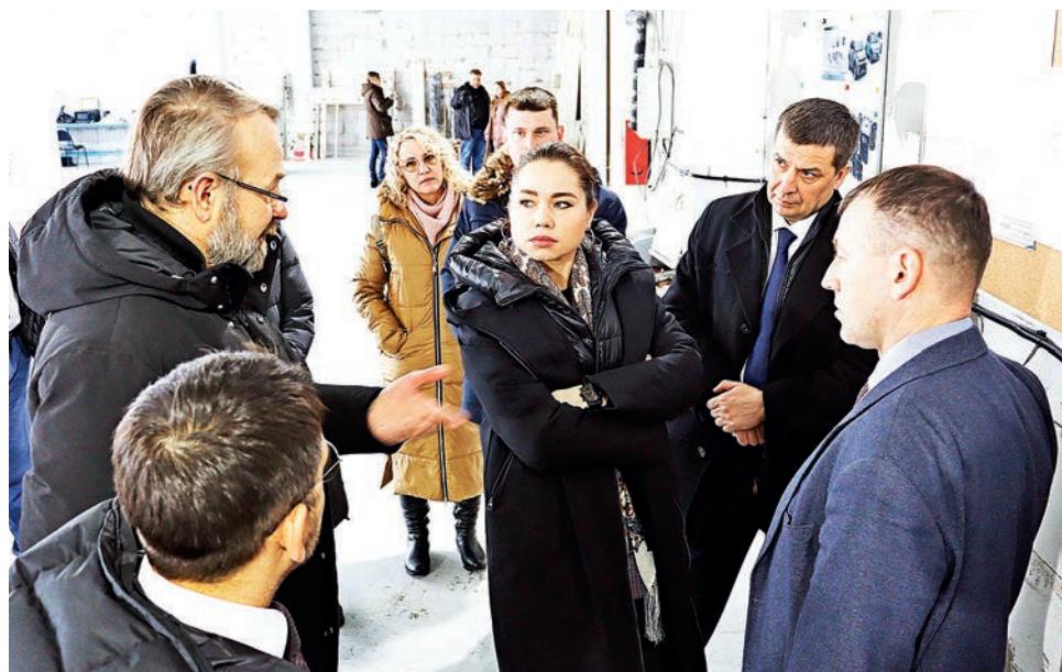
Министр экономики Красноярского края (на фото в центре) пообщалась с резидентами ТОСЭР. Представители компаний «13 элемент» и «РОСТ» показали свое производство.