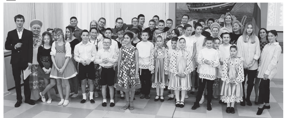
▲ Ученики школы-интерната и школы №101 обменялись творческой энергией и поделились опытом друг с другом.

Участниками первого фестиваля стали ученики 101-й школы.