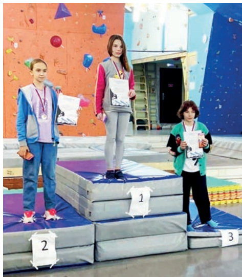
▲ Дюжина наград в копилку железнгорских чемпионов.