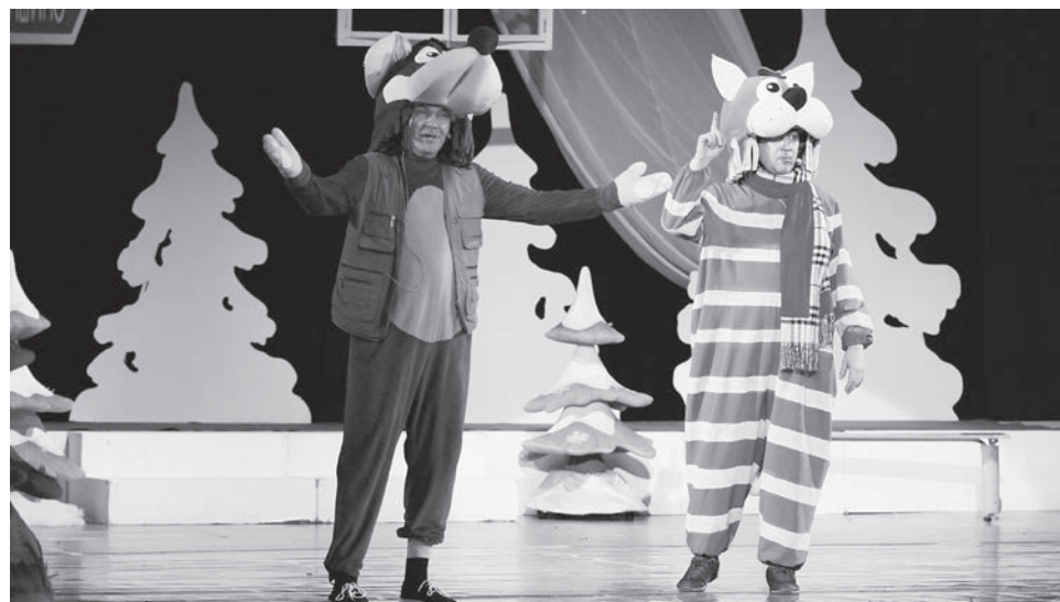
▲ Шарик и кот Матроскин отлично справились с ролью ведущих.