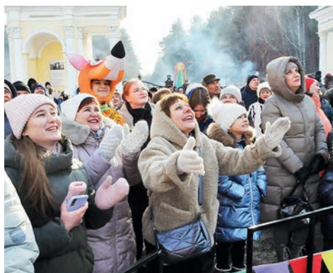
▲ Лисичка – главный болельщик.