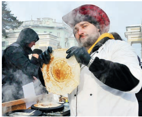
▲ Налетай, народ, на блинчики!