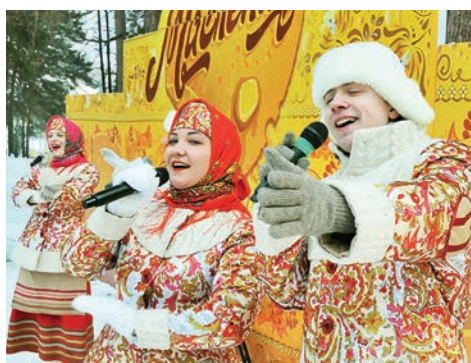
▲ Горожан развлекали артисты творческого союза «Светоч» из Красноярска.