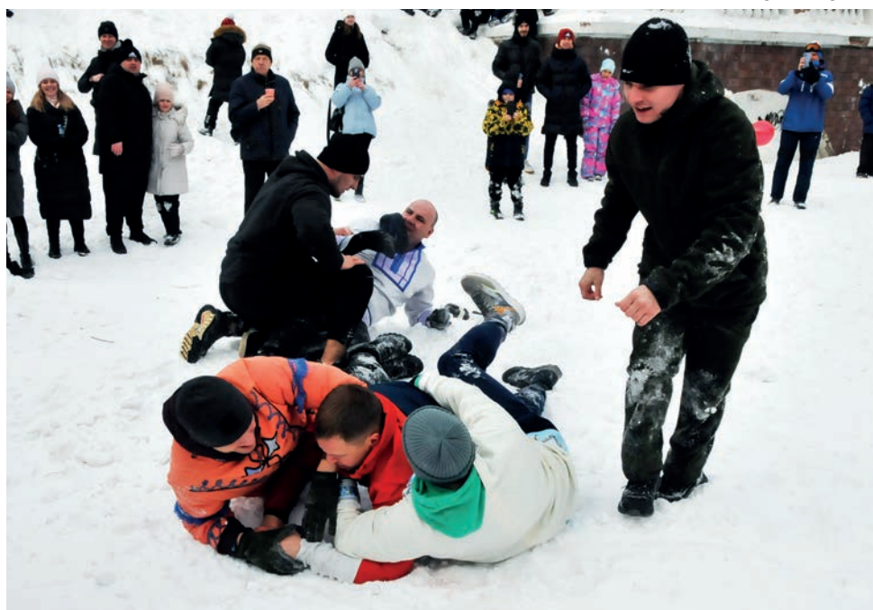
▲ Молодецкие состязания – для настоящих мужчин!

▼ Хорошо зима горит, ярко. Приходи, весна, ждем!