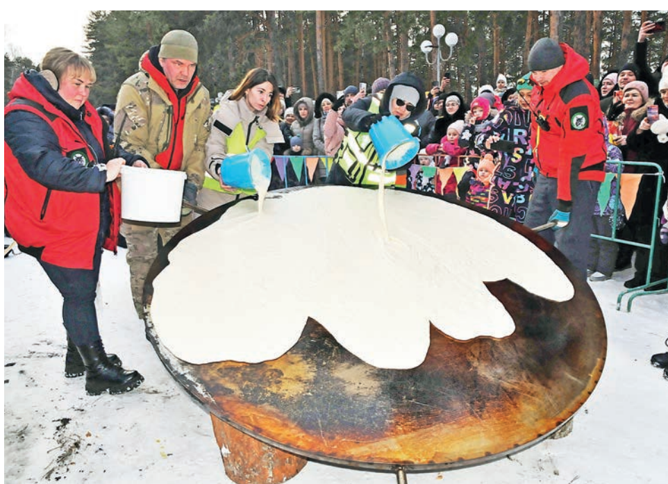
▲ Двухметровый блин получается из 20 литров теста.