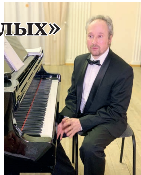
— В чем секрет успеха дуэта?

— Эх... я бы так сказал — женщины. Самые красивые женщины живут в России. Таких глаз ни в какой другой стране не увидишь. Наши женщины великие, и только они могут вдохновлять на музыку, которая в себе заключает космос, весь звуковой мир, который существует. Я вам признаюсь, более счастливых людей, чем музыканты, я не знаю — мы всегда прикасаемся к великому, потому что оно вот здесь, под нашими руками.