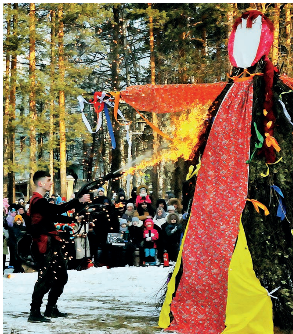
▲ Арт-группа FaBuLa зажгла – в том числе и чучело Масленицы.