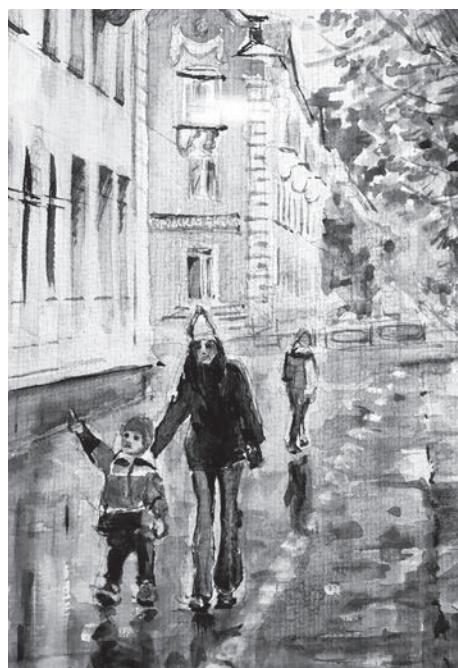
▲▼ Среди городских пейзажей на экспозиции можно увидеть и автопортрет художника.