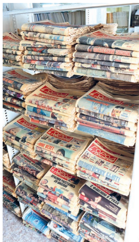
▲ Молодые сотрудники ГиГ прикоснулись к истории первого печатного издания города.