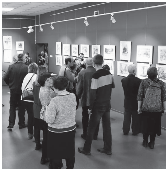
▲ Посмотреть на творчество Юрия Илларионовича пришло немало любителей живописи.