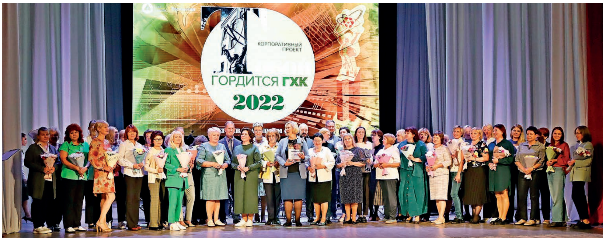
▲ Коллектив бухгалтерии – абсолютный победитель конкурса.