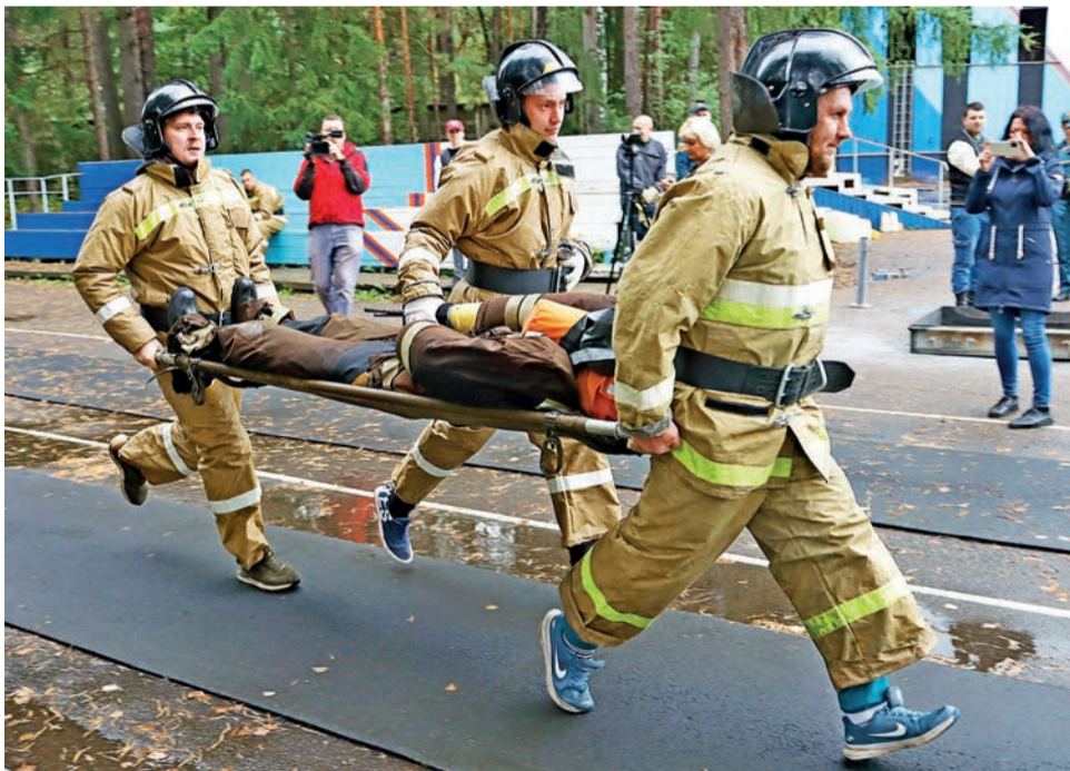
▲ На втором этапе переносят пострадавшего и оказывают первую помощь. Вес манекена – 80 кг.