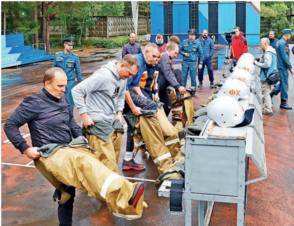
▲ Для отличного результата нужно надеть боевку менее чем за 25 секунд.

Раньше соревнования проводились по критериям пожарно-спасательного спорта. Тогда участники поднимались