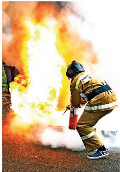
▲ Самый зрелищный этап – тушение огня в противне.