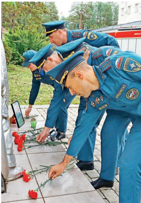
▲ Пожарные-спасатели почтили память Героя РФ Евгения Зиничева.