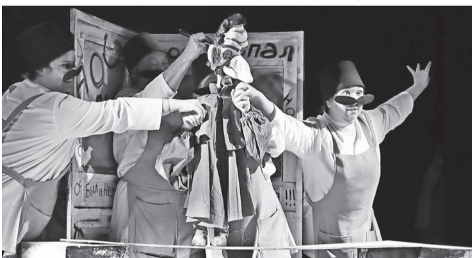
▲ «Нос» режиссера Чакчи Фросноккерса и художника-постановщика Ульяны Елизаровой – пример того репертуара, который, по замыслу руководства «Золотого ключика», должен привлечь в театр и взрослую аудиторию. Спектакль действительно непростой, неоднозначный. В нем есть над чем подумать и с чем сравнить свои ощущения от странного, фантастического мира знаменитой гоголевской повести. Во время обсуждения предпремьерного показа зрители говорили, что собираются перечитать «Нос» или впервые открыть его для себя. Одно это – уже достойный итог работы создателей спектакля.

тывающие. Хотелось держать кулачки, чтобы все получилось, и театр стал современным, технологичным, красивым. Разумеется, главный вопрос – на какие средства осуществлять такой желанный, но дорогостоящий проект?