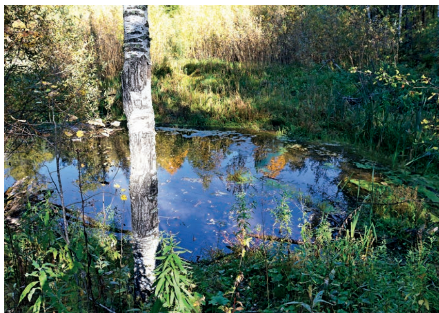
▲▲ Дамба, перегородающая озеро, давно разрушена. Техническое решение по ее восстановлению есть. Осталось найти финансирование.

При минусовых температурах около разлома в дамбе образуется огромная, высотой в человеческий рост, наледь. И весь этот массив льда, подтаивая при каждой оттепели, сползает на лыжероллерную трассу. А окончательно «ледник» сходит только поздней весной. Причем до этого талая вода обильно заливает дорожки, вымывает грунт и разрушает асфальт.