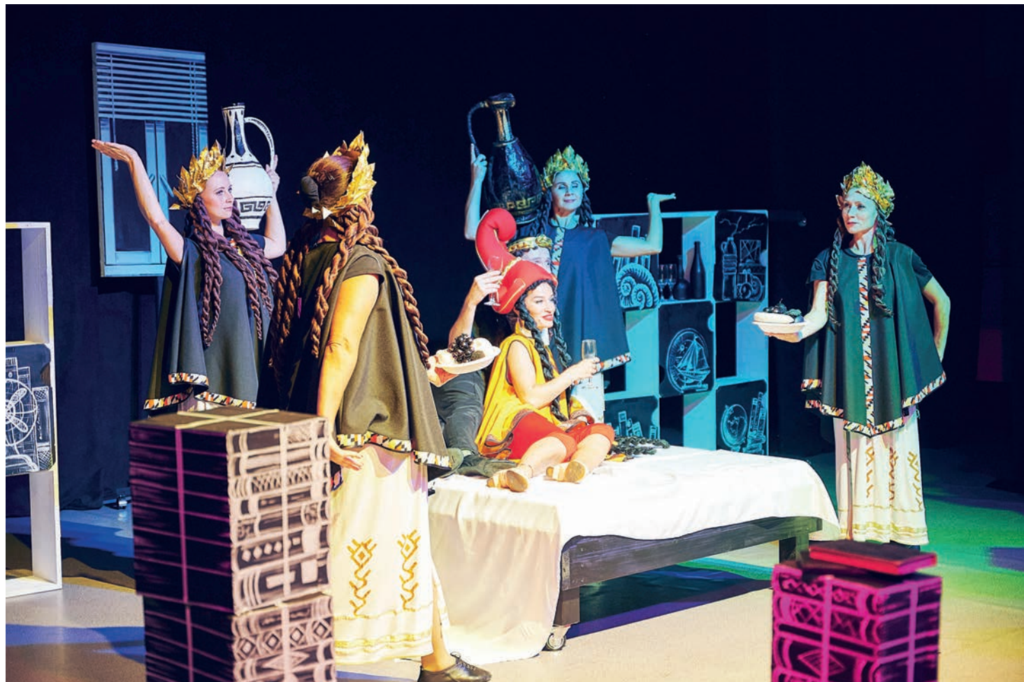
▲ Женщина, Ваше Величество...

– Женщину надо слушать и слышать, и все будет хорошо, – с нескрываемой