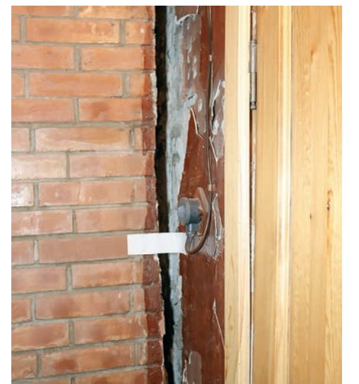
▲ С обратной стороны здания образовательного учреждения образовалась щель между стенами. Пока одно из помещений клуба функционировать не будет.