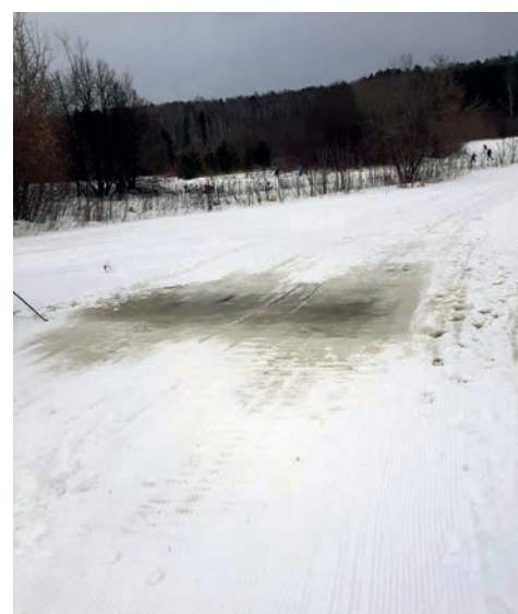
▲ Зимой и весной лыжероллерную трассу заливает водой из-за разлома в дамбе. Из-за этого значительно страдает тренировочный процесс.