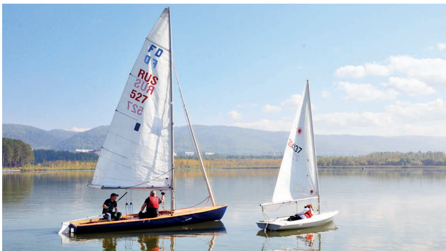
▲ Яхтсмены называют себя «ветрозависимыми». Нет ветра — нет гонки.

Совсем скоро в секции парусного спорта будет пополнение. Автономная некоммерческая организация «Физкультурно-спортивный центр» победила в конкурсе Фонда президентских грантов и получила 3,5 миллиона рублей. Эти средства пойдут на развитие парусного спорта в Железногорске. Планируют приобрести лодки, паруса и многое другое.