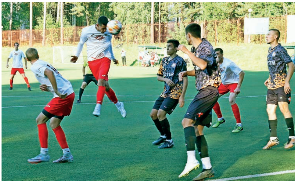
▲ На втором месте в турнирной таблице команда «Олимпик», на третьем — «Арарат-СССР».