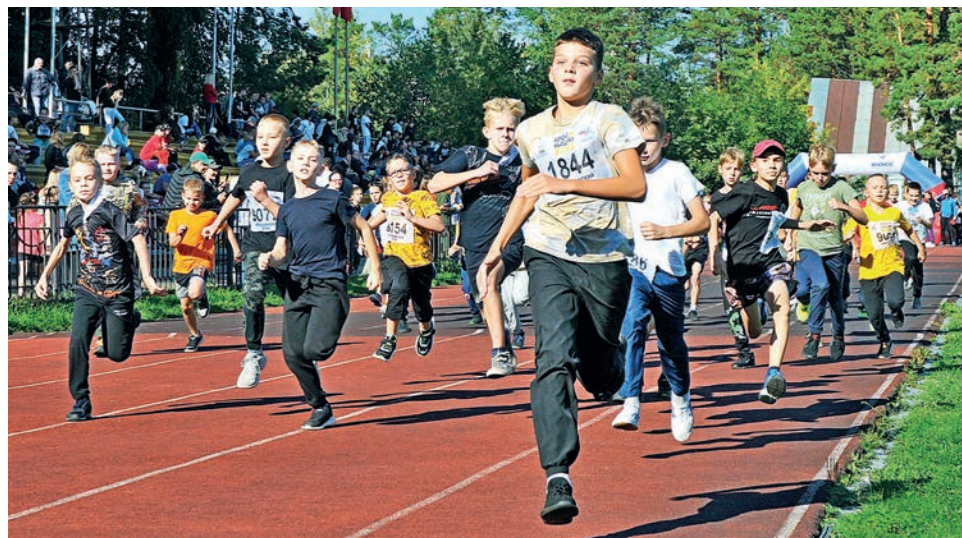
▲ По словам организаторов, в «Кроссе нации» побеждает каждый!

На финише малышей ждали сладкие призы, победителей — медали и грамоты. Отличившимся спортсменам