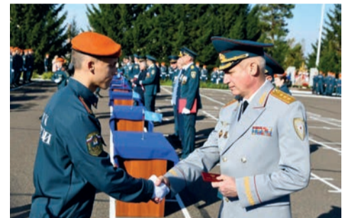
▲ В день 15-летия Академии МЧС России состоялась торжественная церемония приведения к присяге курсантов первого курса и принесения клятвы студентов.

ют постоянно совершенствовать образовательный процесс, делать его более продуктивным и интересным, – отметил Супруновский. – Плодотворная работа руководства, профессорско-преподавательского состава Академии направлена на воспитание и развитие у будущих профессионалов таких незаменимых качеств как любовь к Родине, гуманизм, честь, отвага и ответственность за принятые решения.