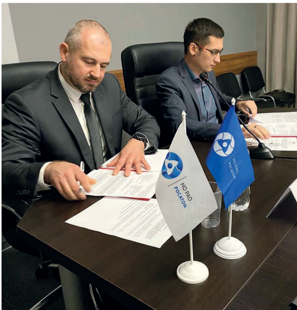
▲ Подписание меморандума о сотрудничестве и взаимодействии между Национальным оператором по обращению с радиоактивными отходами (НО РАО) и Общественным советом при Министерстве экологии и рационального природопользования Красноярского края прошло 21 сентября.