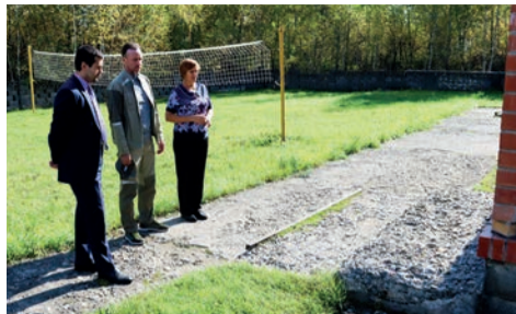
▲ Бетонную отмостку разбивает дождевой водой с крыши.

Еще одна болевая точка «Октября» – нет водостоков. Как следствие – разбитая дорожка дождевой водой бетонная отмостка. Ее с большим трудом починят в этом