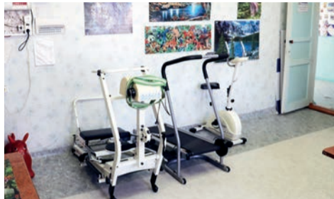
▲ «Октябрь» центр притяжения спортивной жизни в Шиверах.

строительном сезоне: найти бетон в Шиверах тоже оказалось очень непросто, повезет из Красноярск. А на следующий год необходимо запланировать работы по организации водослива, подчеркнул глава ЗАТО. Иначе весь нынешний ремонт впустую. А вот другие проблемы клуба уже удалось решить.