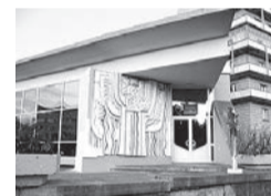
Благодарим за сотрудничество коллектив Железнодорожского территориального отдела ЗАГС