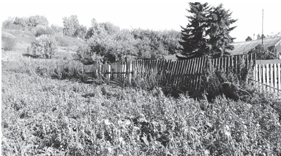
Анастасия ЗЫКОВА. Подготовлено при содействии пресс-службы МУ МВД России по ЗАТО Железногорск и СУ ФПС№2 МЧС России

крупном размере растений, содержащих наркотические средства или психотропные вещества либо их прекурсоры статьей 231 УК РФ предусмотрено наказание в виде лишения свободы на срок до 2 лет, а если речь идет об организованной группе и особо крупном размере – до 8 лет соответственно. Помимо этого, за непринятие мер по уничтожению дикорастущих растений, содержащих наркотические средства или психотропные вещества либо их прекурсоры, предусмотрена ответственность административная (статья 10.5 КоАП РФ). За данное нарушение предусмотрено наказание в виде штрафа от 3 до 4 тысяч рублей для физических лиц, от 5 до 10 – для должностных и от 50 до 100 тысяч рублей, если нарушение допущено юридическим лицом.