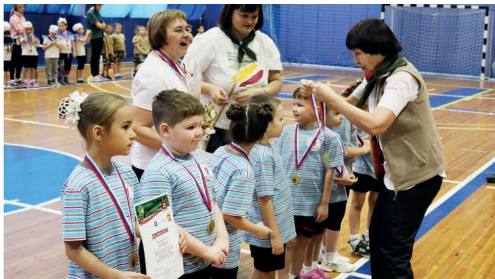
▲ За участие в эстафетах финалистов наградили медалями и кубками.