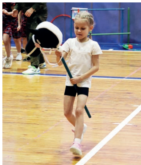
▲ Почти хоббиборсинг, даже лучше!