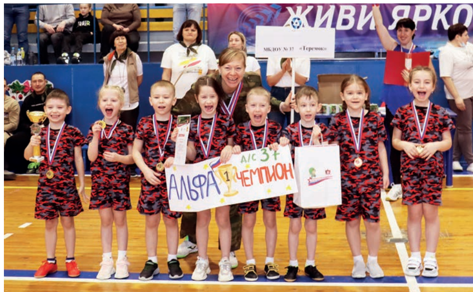
▲ Победителем соревнований стала команда детского сада №37 «Теремок».