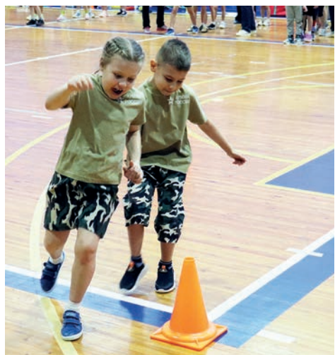
▲ Капитаны команд переправляли сверстников с одного берега на другой.