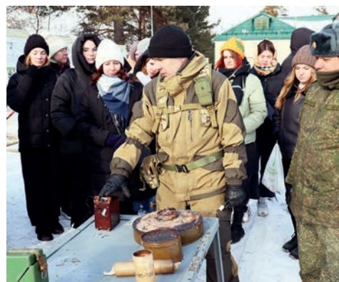
▲ Студентам рассказали, какое вооружение и оборудование использовались на учениях. Это крупнокалиберный пулемет «Корд», средства аэрозольного противодействия (универсальные дымовые шашки, ручные дымовые гранаты), имитаторы разрывов артиллерийских снарядов и электровзрывпакет, который используется для борьбы с беспилотниками на высоте до 60 метров.

Неприметный автомобиль проезжает мимо территории войсковой части. Внезапно пассажир открывает огонь. Авто приближается к КПП, раздается взрыв... Помощники террористов продолжают стрелять по части из РПГ и автомата.