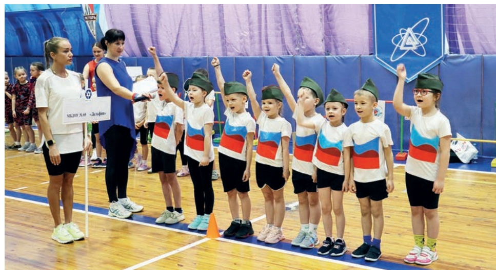
▲ Серебро турнира забрали воспитанники детского сада №65 «Дельфин».