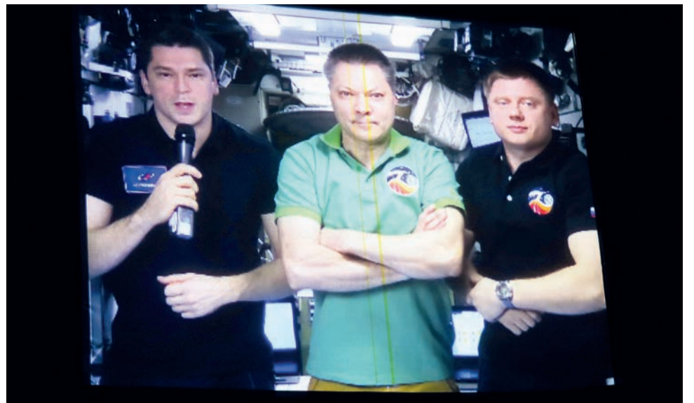
▲ Космонавты передают решетневцам привет с МКС и желают успехов в интересах России.

– Концерт – праздник для всех нас! Сегодня испытываю эмоции полета – ра-