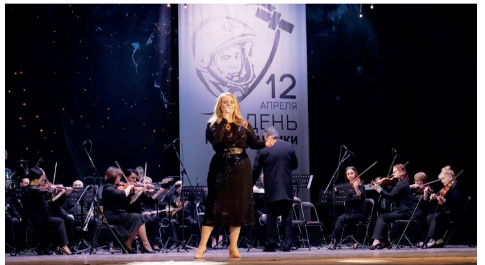
▲ Спеть с оркестром на сцене – такой вызов по силам смелым и талантливым.

Все получилось. Смелость и трудолюбие участников проекта «Пою с оркестром» заслуживают уважения. Выйти на сцену и спеть перед залом – такой вызов по силам тем, кто готов, как Юрий Гагарин, покорять неизведанные дали. И это уже чуть больше, чем просто самостоятельность, потому что здесь поет душа! Космический арт-фестиваль продолжается.