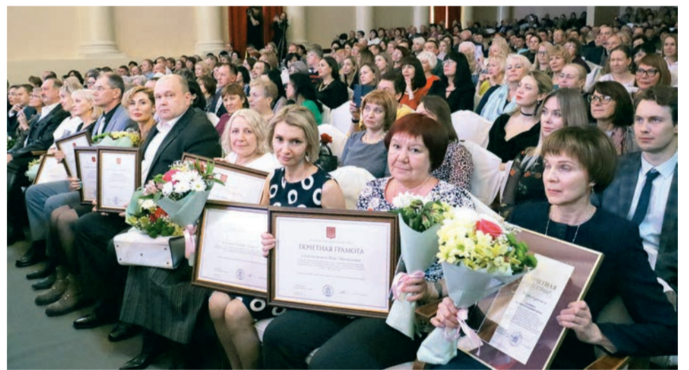
▲ В День космонавтики настроение – просто космос!