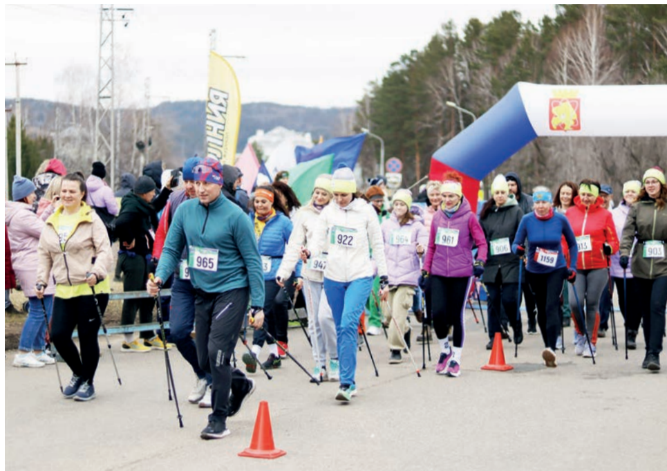
▲ Посторонитесь! Стартуют ходоки!

Километр в основном бежали дети и те, кто просто хотел поддержать добрую традицию. На старт 3 км вышли участники, которые хотели бы проверить свои силы, но пока не готовы к более длинным дистанциям. А на 12 км решились самые выносливые.